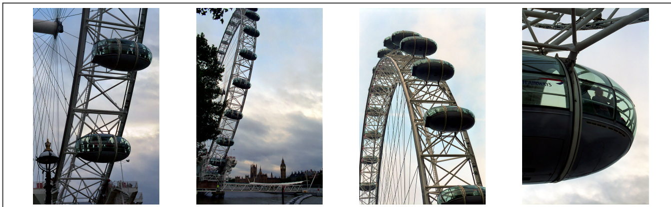
Le "Big Eye" de Londres

La grande roue de Londres a été ouverte au public en 2000. Elle est construite sur la berge sud de la Tamise et permet aux touristes d'avoir une vue imprenable sur la cité.