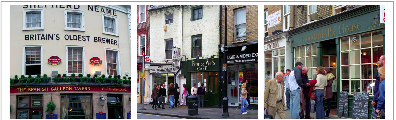
Les rues de Greenwich

Greenwich est une ville située à une dizaine de kilomètres, au sud-est de Londres. Elle est connue pour son histoire maritime, son emplacement sur le méridien du même nom et ses rues colorées et vivantes.