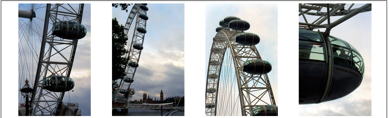
Le "Big Eye" de Londres

La grande roue de Londres a été ouverte au public en 2000. Elle est construite sur la berge sud de la Tamise et permet aux touristes d'avoir une vue imprenable sur la cité.