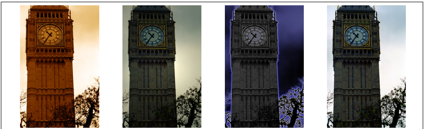
Art photographique sur Big Ben

Big Ben est très certainement le monument le plus connu de Londres. La tour horloge appartient au complexe de Westminster. Construite en 1859, ses principales caractéristiques sont son carillon, dont la sonnerie est reconnaissable dans le monde entier, et son horloge représentée sur les quatre faces du bâtiment.