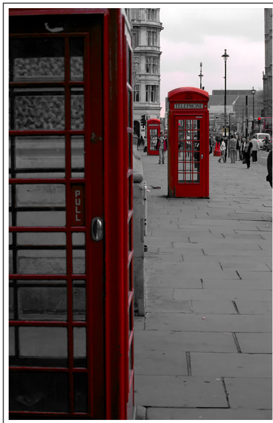
Un symbole de l'Angleterre, ses fameuses cabines téléphoniques rouges