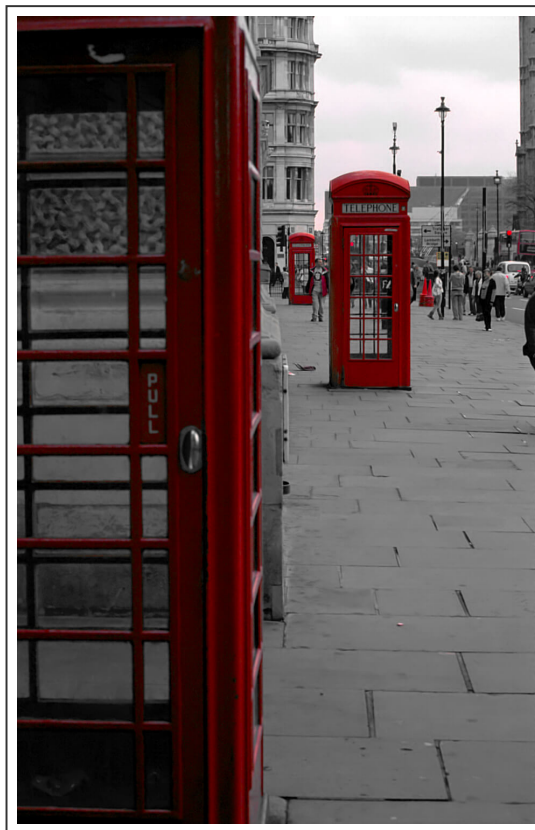
Un symbole de l'Angleterre, ses fameuses cabines téléphoniques rouges