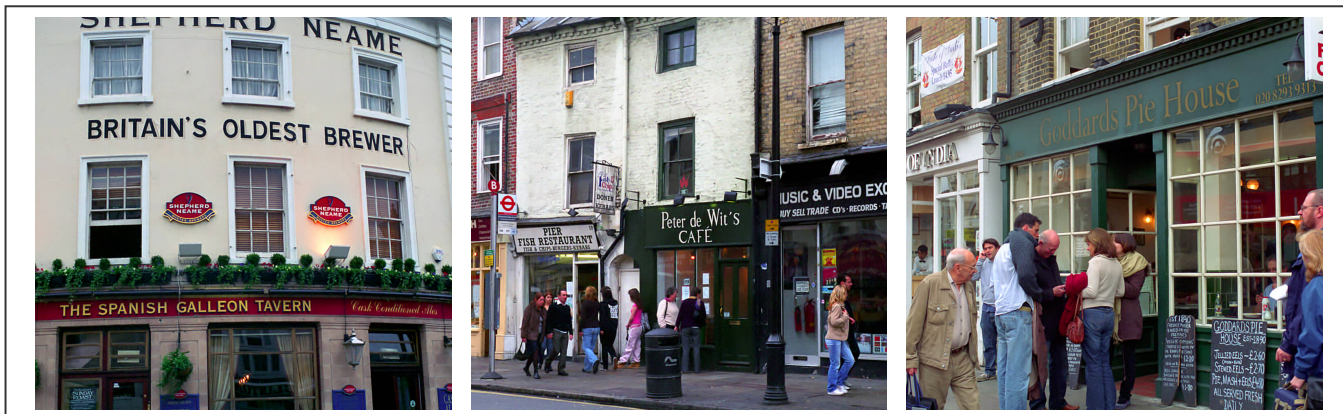
Les rues de Greenwich

Greenwich est une ville située à une dizaine de kilomètres, au sud-est de Londres. Elle est connue pour son histoire maritime, son emplacement sur le méridien du même nom et ses rues colorées et vivantes.