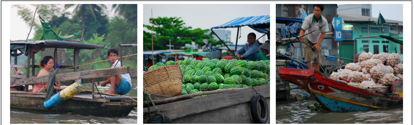
Le marché flottant de Bac Liêu