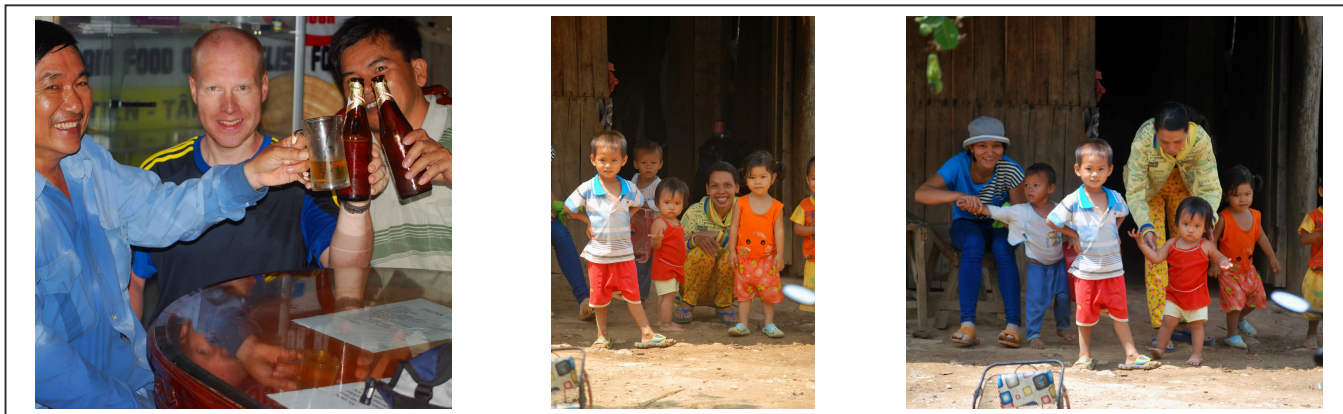
Une bonne bière fraîche, enfants rencontrés dans le parc

parc pour le visiter, ce qui est fort agréable. Quelques chambres sont également à disposition pour y passer la nuit. Son écosystème comprend de nombreuses essences d'arbres plusieurs fois centenaires. Le parc regorge de sentiers de randonnées, ainsi que des jardins botaniques et une faune sauvage hors du commun, dont des crocodiles. Le climat est tropicale.