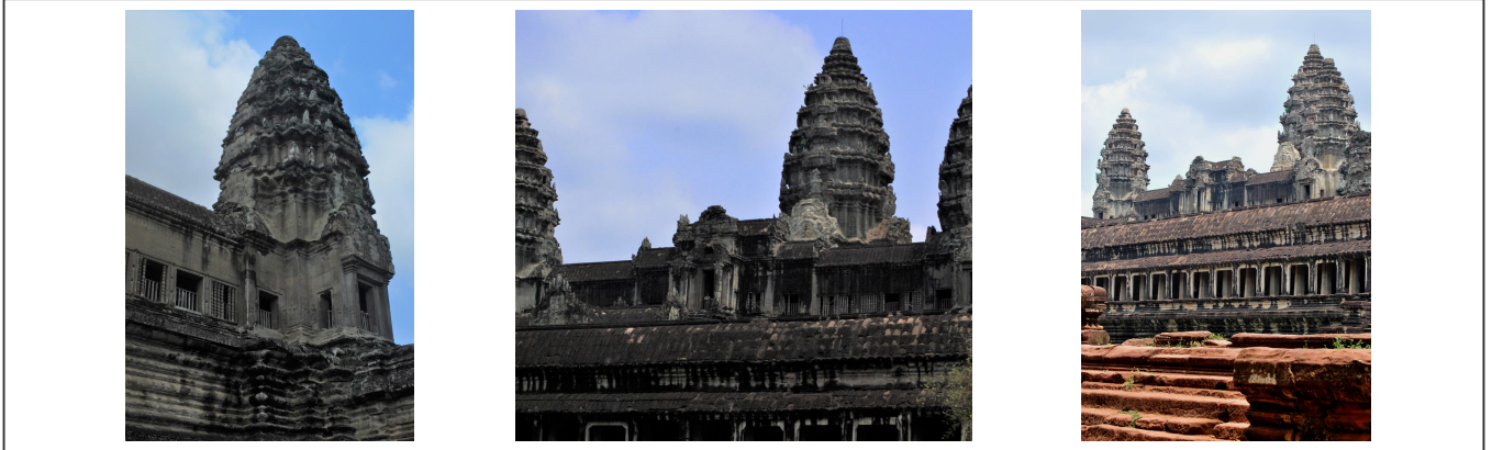
Les temples d'Angkor Wat

Si on se déplace à vélo le long du circuit des temples, on peut voir une architecture unique au monde, la nature a repris ses droits et les racines des arbres poussent dans les vieux murs laissés à l'abandon.