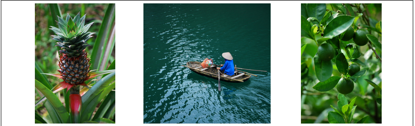
Fleurs et fruits exotiques

Une des attractions à ne pas manquer est le marché flottant. Mais pour ceci, il faut réserver sa place dans une barque auprès d'une agence et se lever tôt, très tôt. Le marché commence à 5h du matin Les marchandises passent d'un bateau à l'autre.