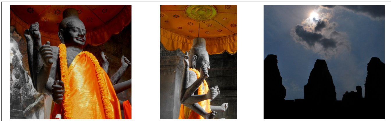
Buddha aux multiples bras et temples de nuit

Voilà, le voyage s'arrête ici. Le Cambodge est bien plus grand, à commencer par sa capitale, Phnom Penh. Ce sera peut-être pour une autre fois.