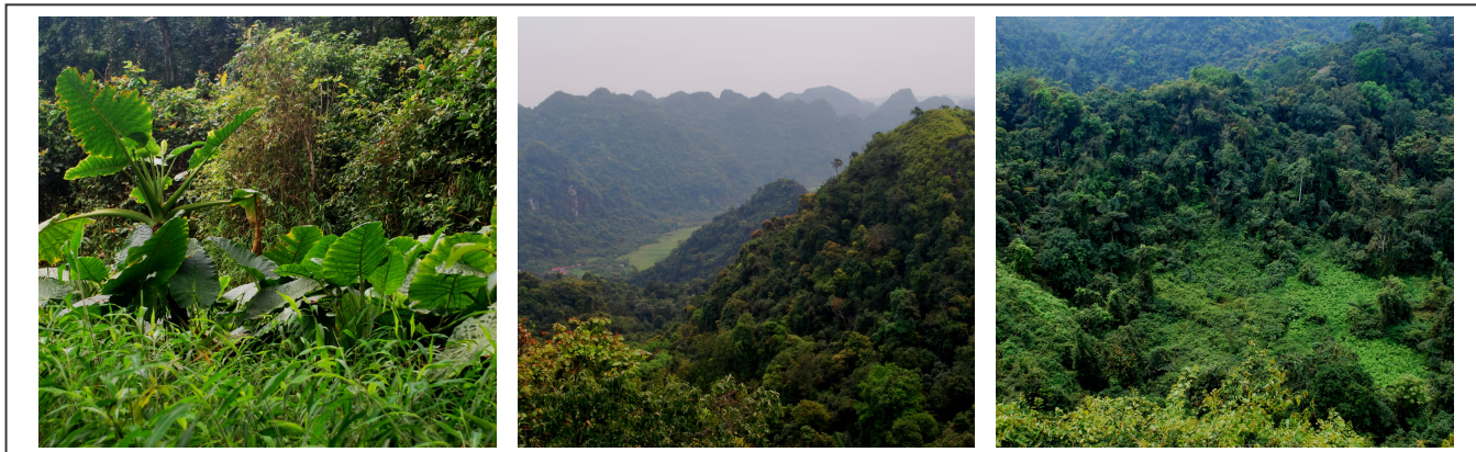
La jungle Vietnamienne comme on se l'imagine

En revenant de la baie d'Ha-Long, il est possible d'accoster sur l'île voisine de Cat Ba . De nombreux hôtels accueillent les touristes qui veulent prolonger l'expérience de la baie d'Ha-Long. Quelques excursions dans la jungle sont possibles, avec l'aide d'un guide. La nourriture y est excellente. C'est vraiment un endroit plein de ressources.