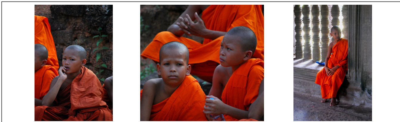
Les moines novices

Il n'est pas rare de tomber sur des processions de jeunes moines ou des groupes entiers suivant l'enseignement de Bouddha.