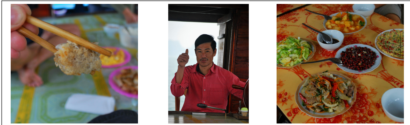
Un dernier tour sur l'eau pour goûter les spécialités locales