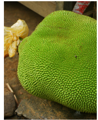
Pêcheurs, Femme habillée sur la plage, Fête des lanternes, Fruit du Jacquier