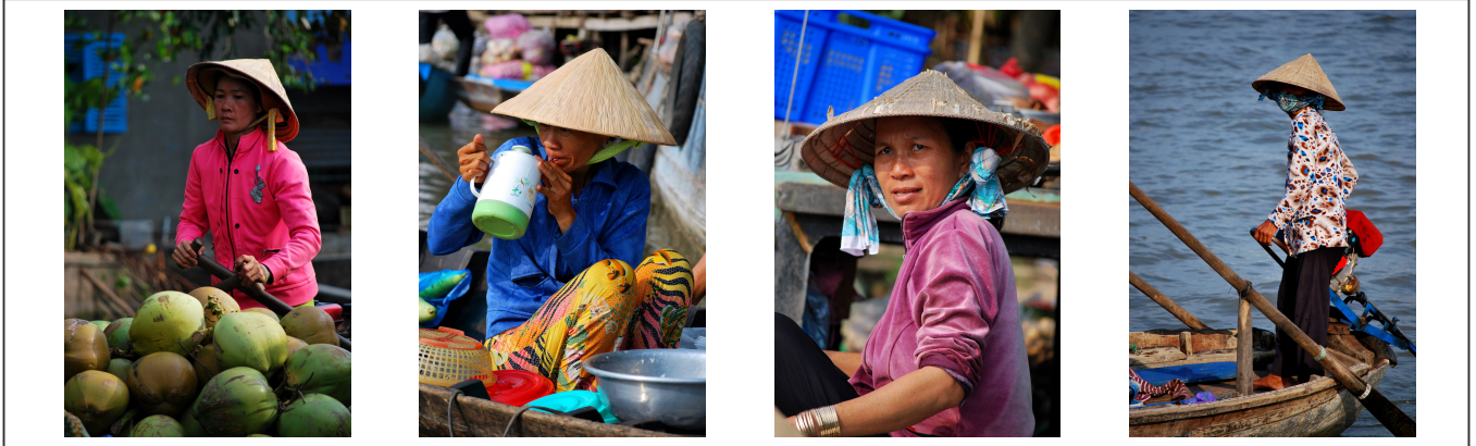
On ne lasse pas de tous ces sourires