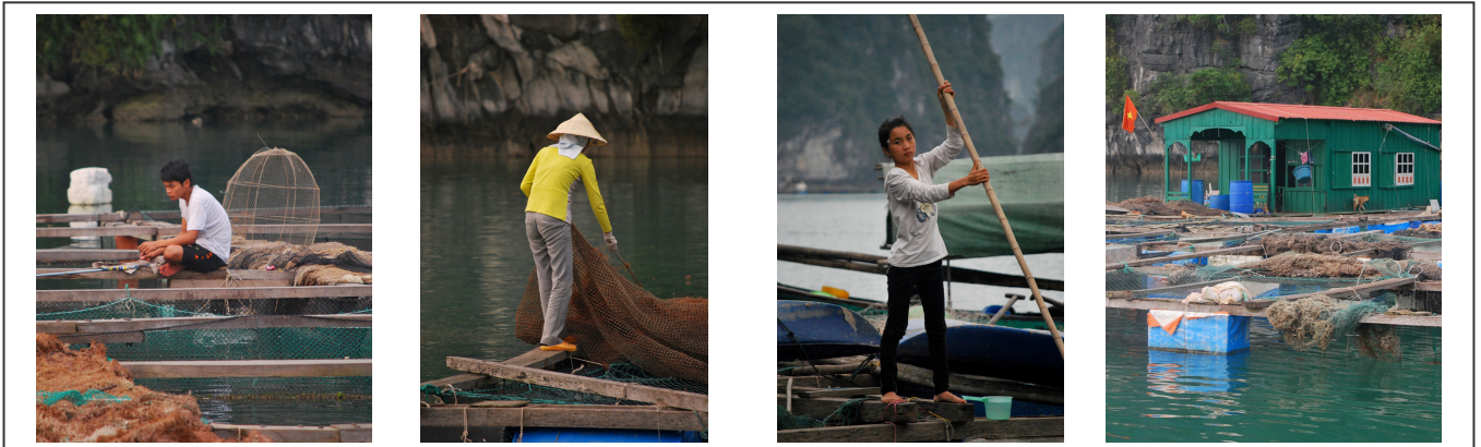
La vie des pêcheurs