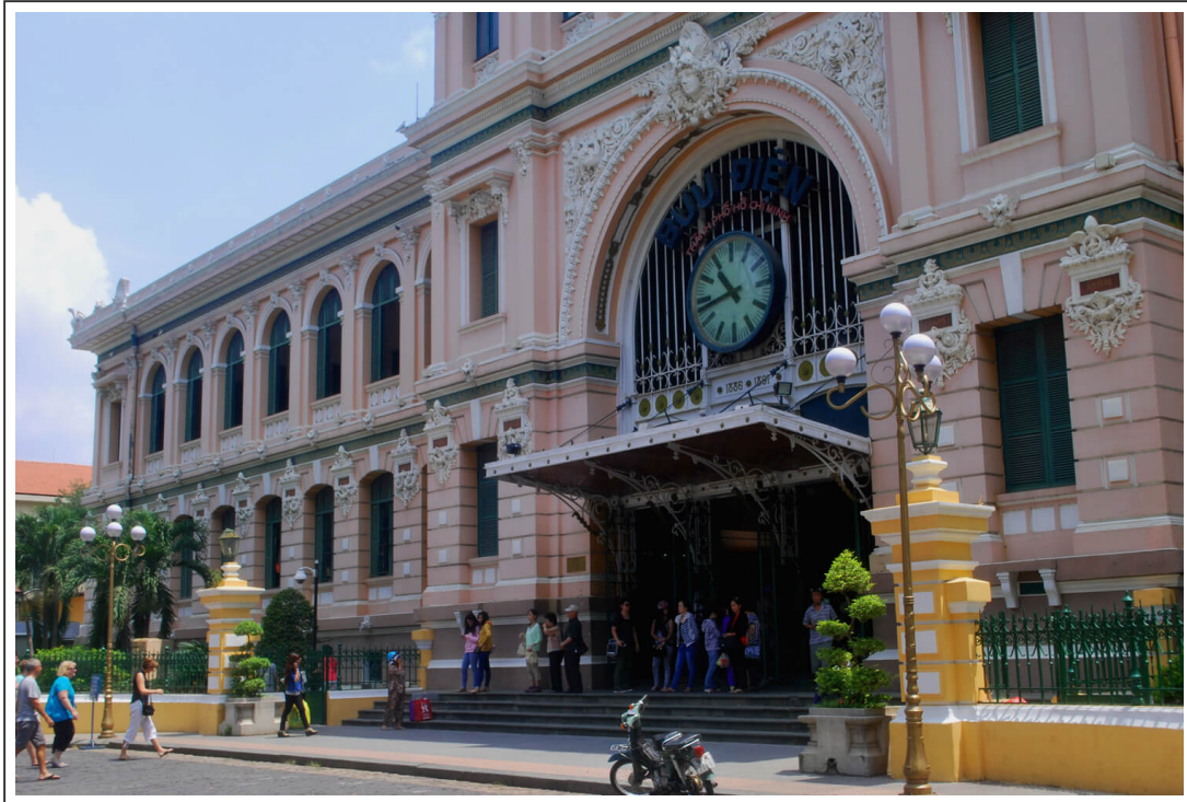
La gare centrale de Saïgon