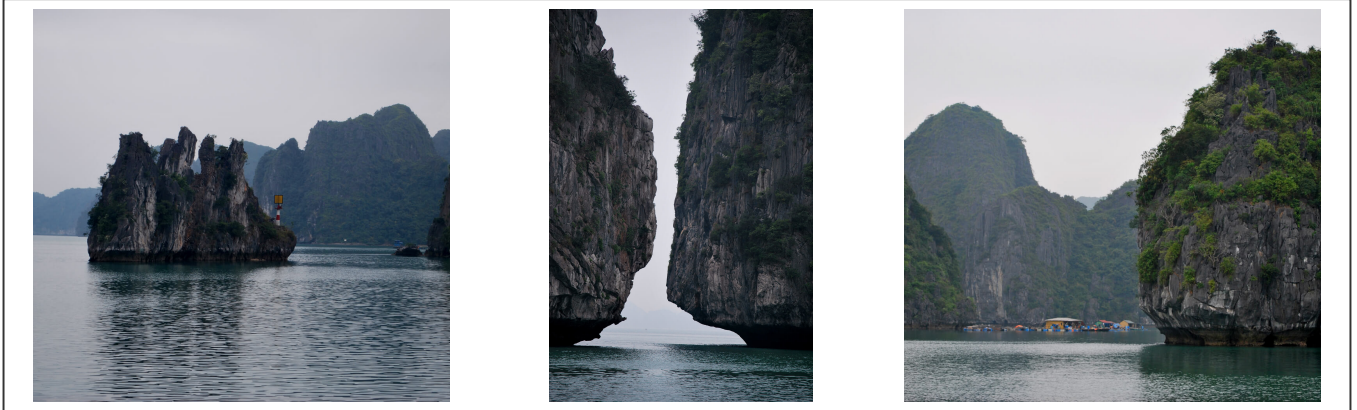
Les fameux rochers de la baie d'Ha-Long