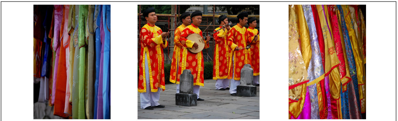
Spectacle et garde-robes