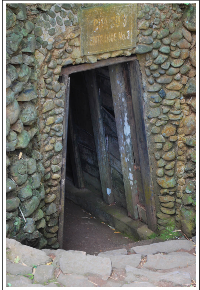
de Vinh Moc