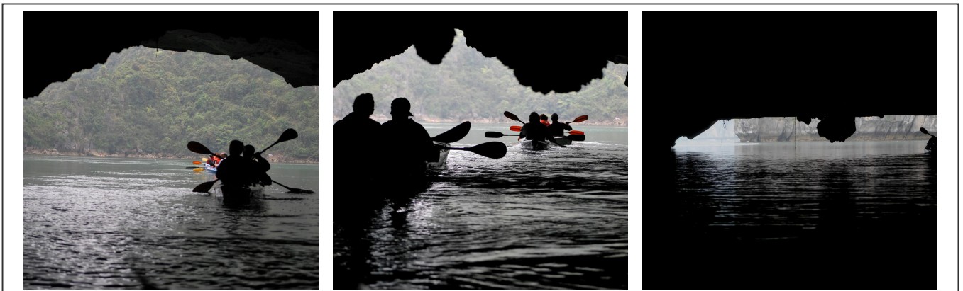
Une bonne idée, visiter la baie d'Ha-Long à son rythme en kayak