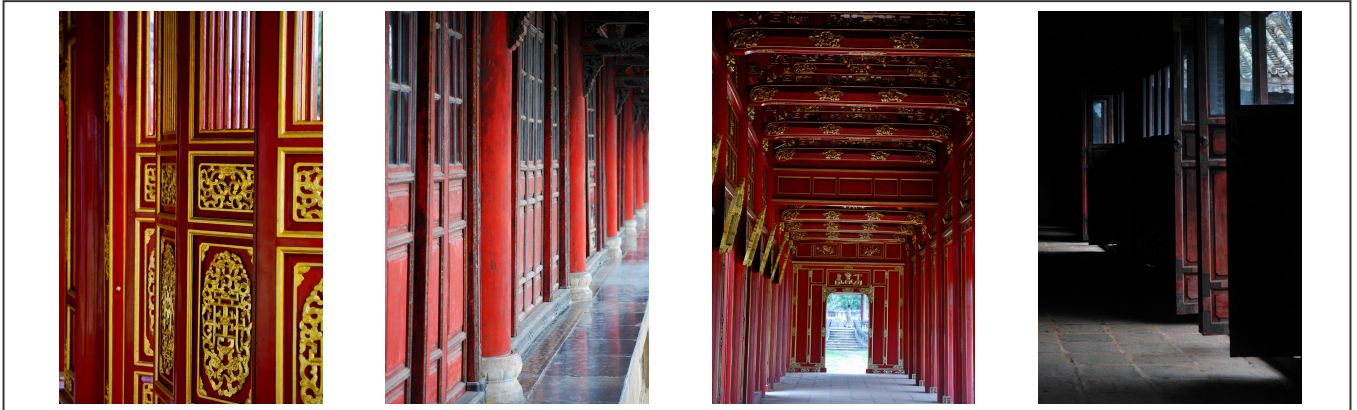
Architecture à Hue

Hue est une cité située à 700km au sud de Hanoï , en longeant la route côtière. Hue est très touristique, à cause de ces vieux bâtiments et de sa cité interdite, siège de la dynastie Nguyen. Beaucoup de spectacles et concert y sont donnés en costume traditionnels.