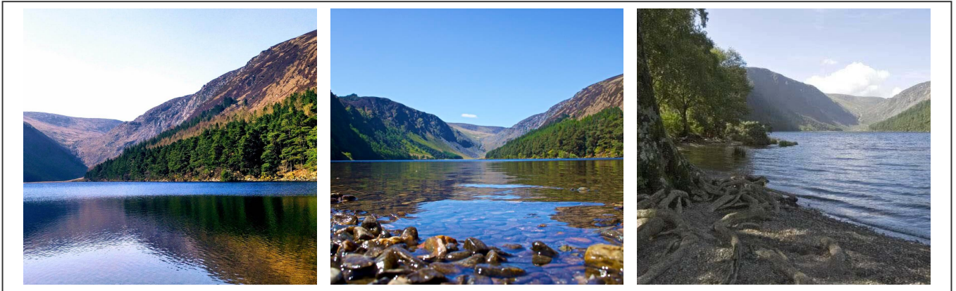
Les deux lacs

Le sentier traverse les champs et des poutres ont été installées en guise de chemin. Attention, celles-ci peuvent être glissantes ! Le chemin monte puis redescend pour atteindre le bout du lac. On remonte ensuite sur l'autre versant pour admirer la vue, avant de rejoindre le point de départ.