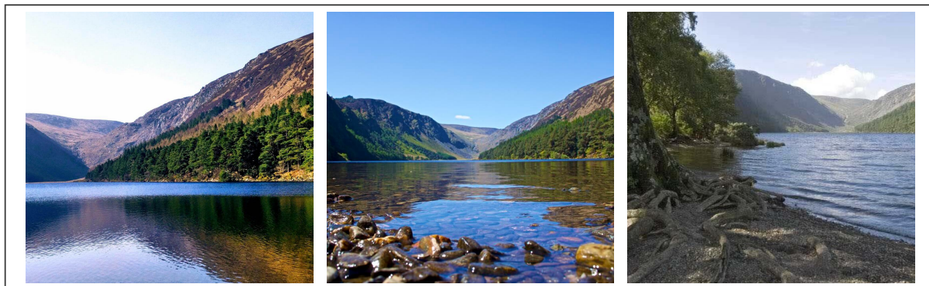
Les deux lacs

Le sentier traverse les champs et des poutres ont été installées en guise de chemin. Attention, celles-ci peuvent être glissantes ! Le chemin monte puis redescend pour atteindre le bout du lac. On remonte ensuite sur l'autre versant pour admirer la vue, avant de rejoindre le point de départ.