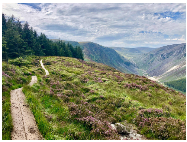
Le chemin de poutres

Le sentier traverse les champs et des poutres ont été installées en guise de chemin. Attention, celles-ci peuvent être glissantes ! Le chemin monte puis redescend pour atteindre le bout du lac. On remonte ensuite sur l'autre versant pour admirer la vue, avant de rejoindre le point de départ.