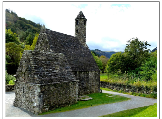
Le site monacale regorge de petites chapelles et de nombreux dolmens

En atteignant le lac du haut, on arrive sur un ancien domaine monacale datant du X ème siècle. Il faut traverser le site pour rejoindre le chemin pédestre qui nous emmène autour du lac. C'est très bien indiqué par des flèches de toutes les couleurs.