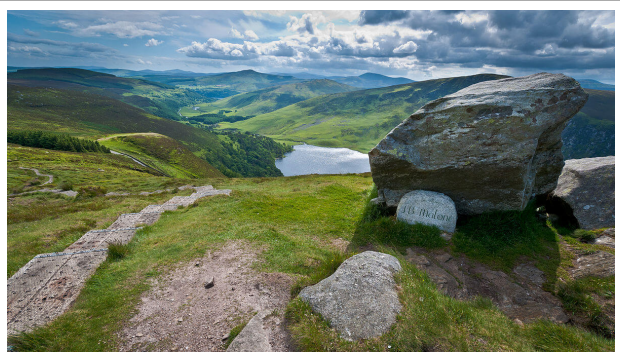
Le lac vu d'en haut

région des lacs de Glendalough . Glendalough signifie en gaélique la vallée des deux lacs et c'est très certainement l'endroit où vous trouverez le plus de touristes si vous vous arrêtez dans le parc. C'est un des endroits les plus beaux de tout le pays. A l'origine, c'était un vaste complexe monacale, mais aujourd'hui, ce qui attire les touristes, ce sont les deux lacs, d'un noir de jais. La vallée qui s'est formée autour des lacs est tout simplement splendide et, cerise sur le gâteau, on peut en faire le tour à pied, à condition d'avoir de bonnes chaussures et un petit peu de souffle.