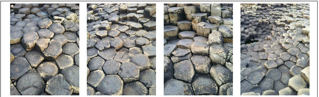
Les colonnes de Basalte de la chaussée des géants