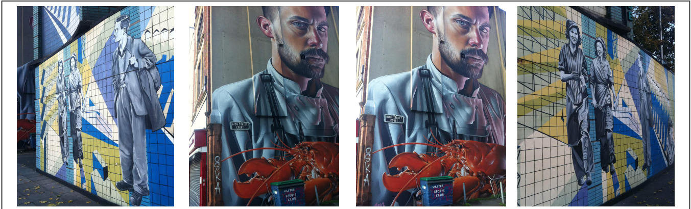
Fresques murales dans les rues de Belfast