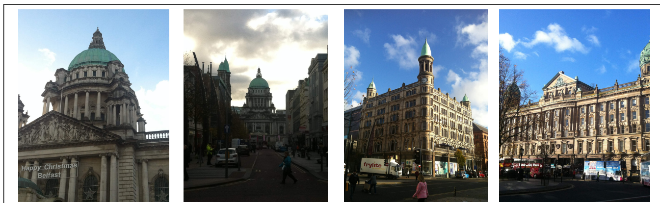
Le parlement de Belfast

La ville de Belfast est très connue pour son chantier de construction naval. C'est dans cette ville que le Titanic a été conçu, puis a coulé en 1912, pendant sa première traversée. La ville lui a dédiée un magnifique musée interactif qui vaut vraiment la peine qu'on s'y intéresse. On peut facilement y passer une demi-journée.