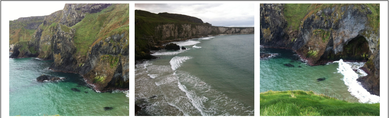
Les magnifiques couleurs de la région côtière

Le nord de l'Irlande est souvent le théâtre de production cinématographique. Ses paysages côtiers à couper le souffle ne sont certainement pas innocent dans ce choix.