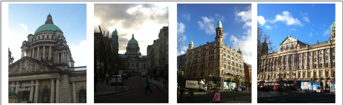
Le parlement de Belfast

La ville de Belfast est très connue pour son chantier de construction naval. C'est dans cette ville que le Titanic a été conçu, puis a coulé en 1912, pendant sa première traversée. La ville lui a dédiée un magnifique musée interactif qui vaut vraiment la peine qu'on s'y intéresse. On peut facilement y passer une demi-journée.