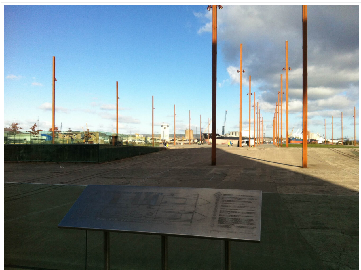
Le chantier naval du Titanic