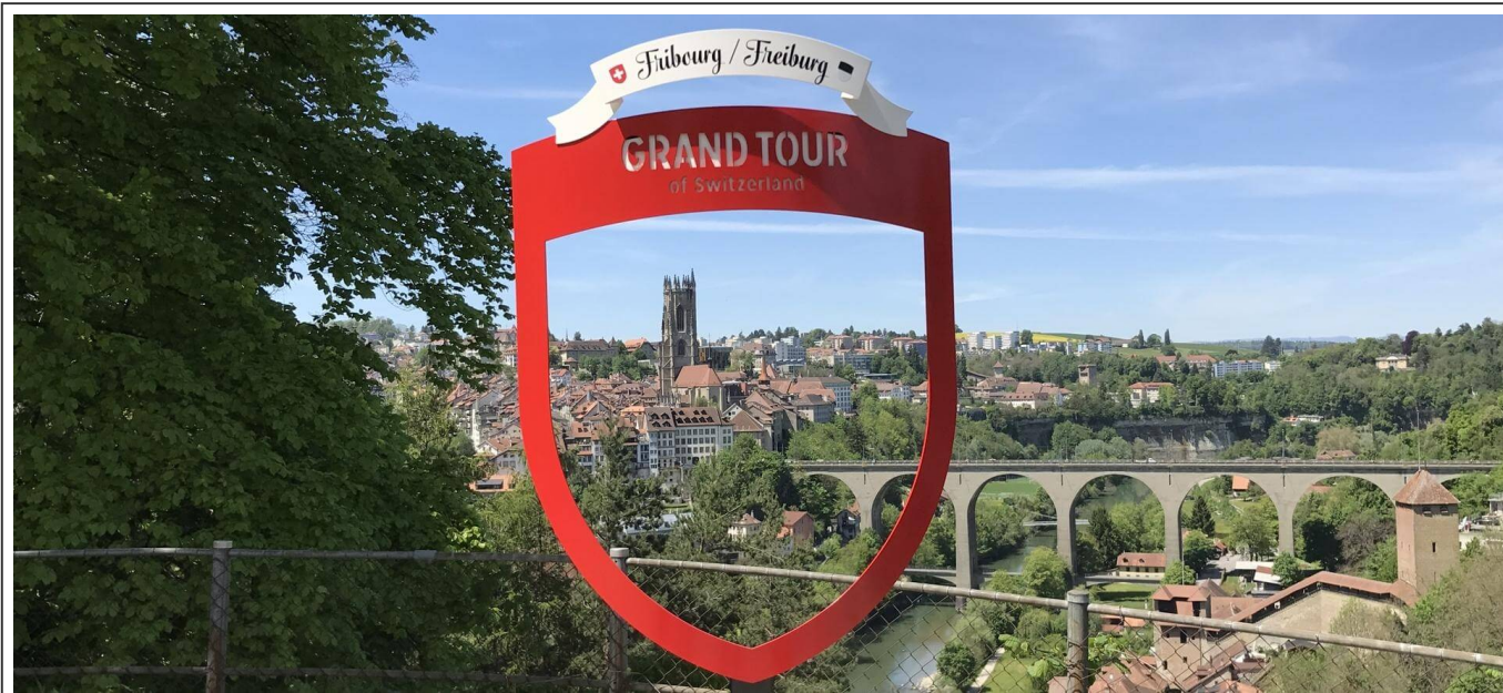
Vue depuis le pont du Gottéron, Fribourg