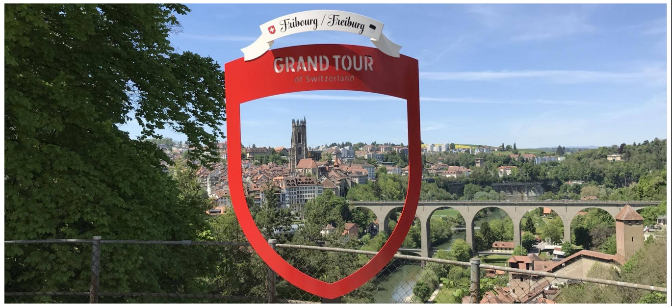
Vue depuis le pont du Gottéron, Fribourg