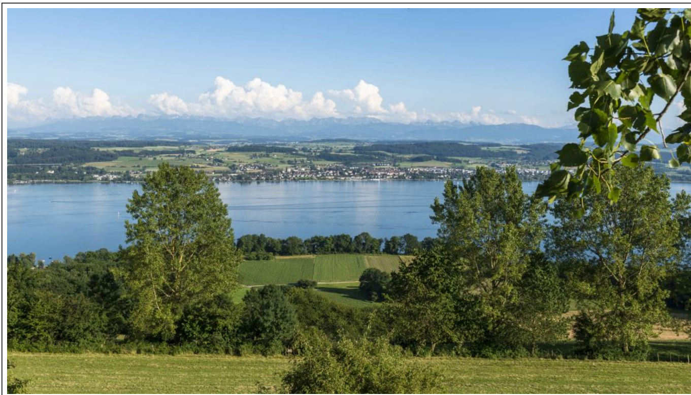
Lac de Morat

Seule difficulté du parcours, la montée dans les environs de Sugiez . La montée n'est pas longue, mais pentue.