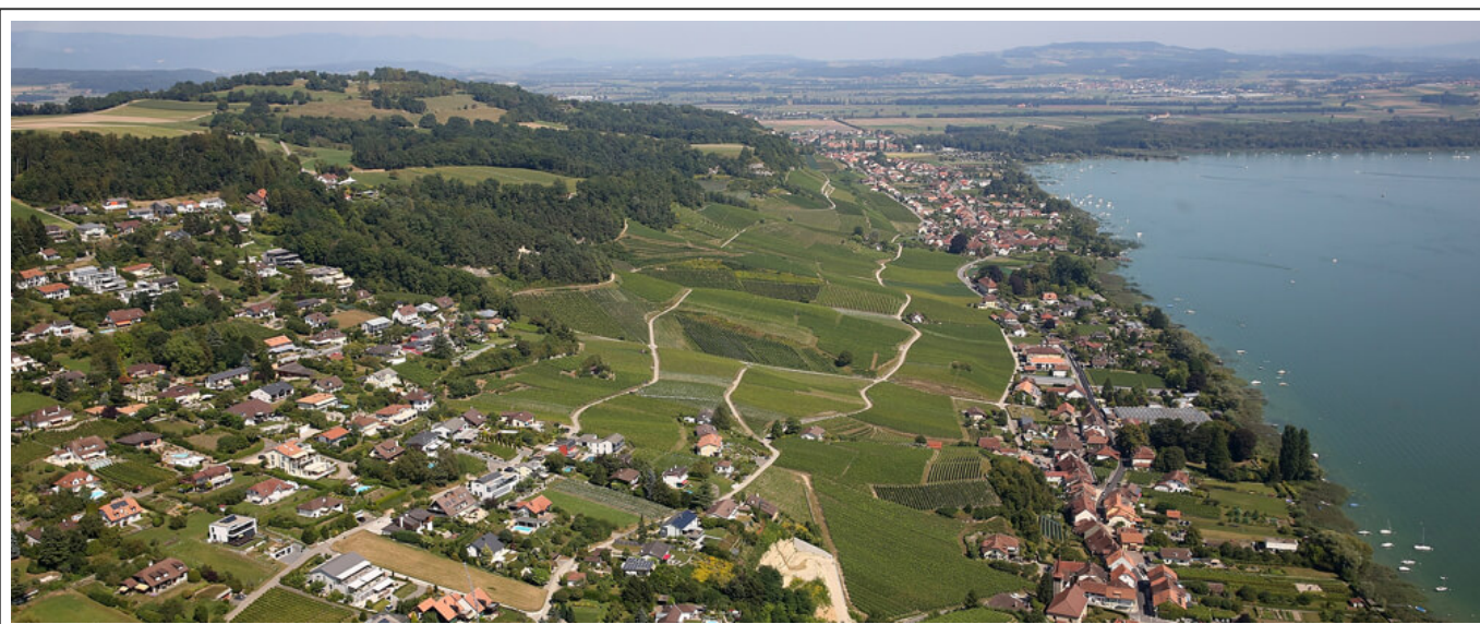
Commune de Mont-Vully et Lac de Morat

Une fois la zone industrielle d' Avenches franchie, le premier contact avec les bords du lac se fait à Faug . Puis on passe par Courgevaux, Morat, Galmiz , avant de rejoindre Sugiez .