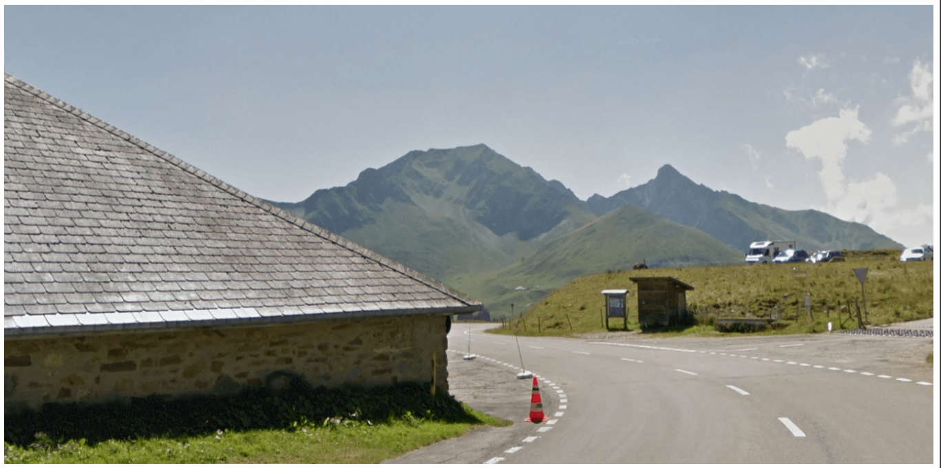
Le Gurnigel pass