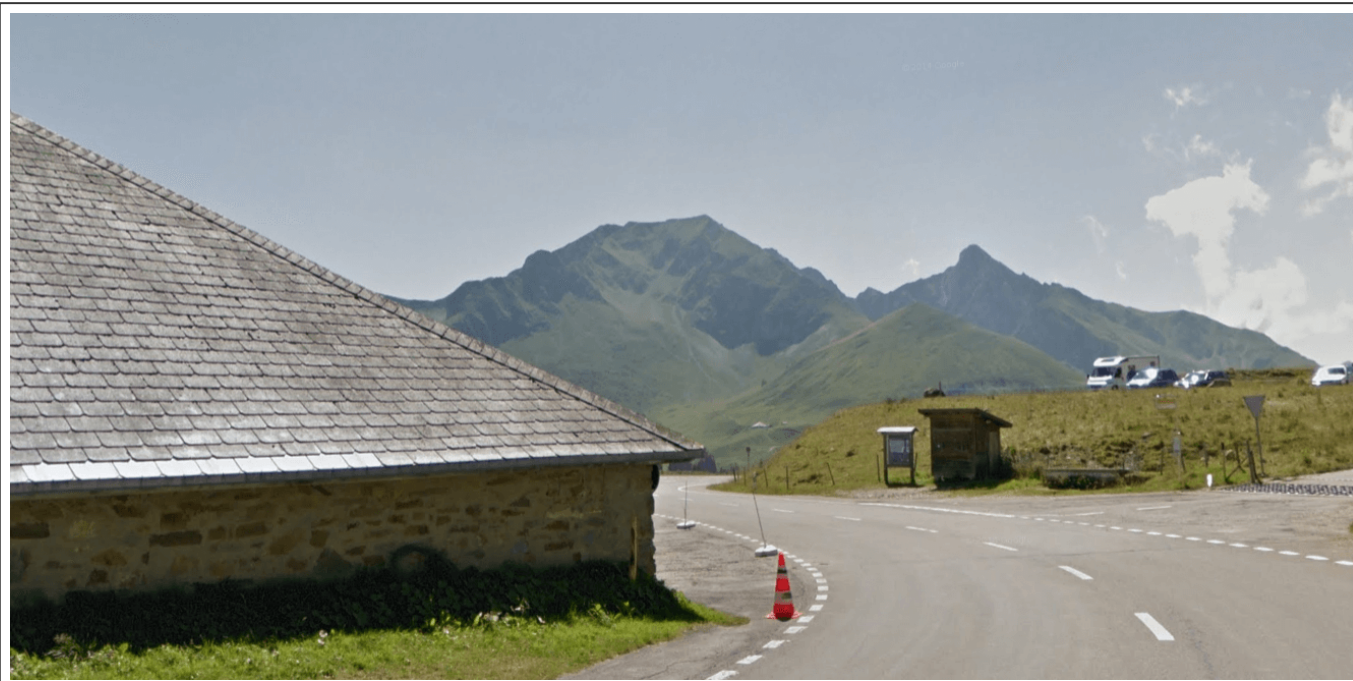
Le Gurnigel pass