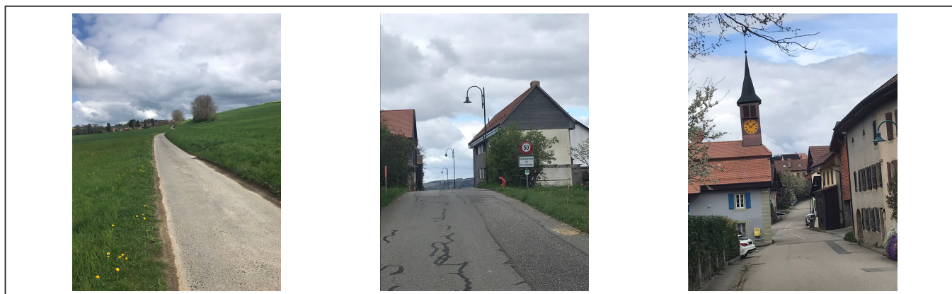
Quelques charmants villages sur la route qui emprunte des routes secondaires

Le tour passe par les villages de Villars-Tiercelin, Chapelle-sur-Moudon, Saint-Cierges, Thierrens, jusqu'à Donneloye. La première moitié de ce parcours est assez facile et descend tout du long.