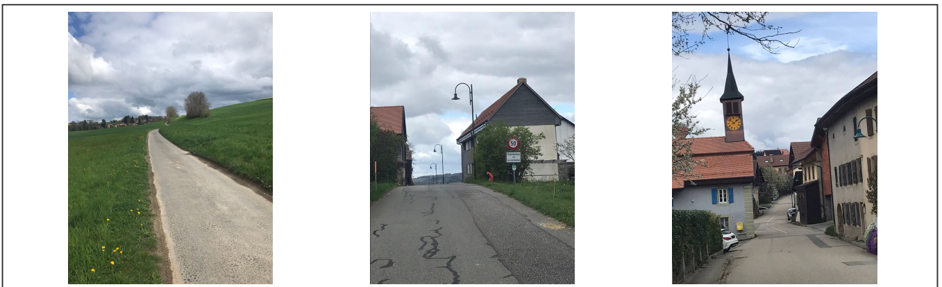
Quelques charmants villages sur la route qui emprunte des routes secondaires

Le tour passe par les villages de Villars-Tiercelin, Chapelle-sur-Moudon, Saint-Cierges, Thierrens, jusqu'à Donneloye. La première moitié de ce parcours est assez facile et descend tout du long.