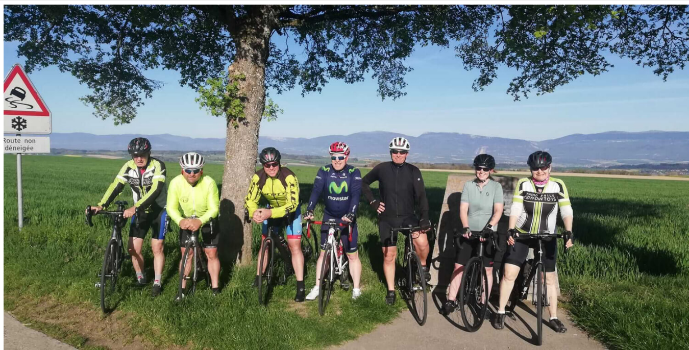
Le Cyclophile romontois