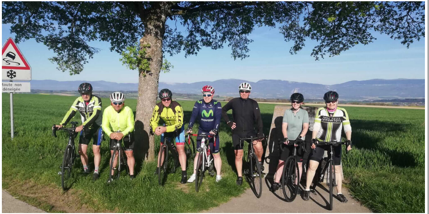
Le Cyclophile romontois