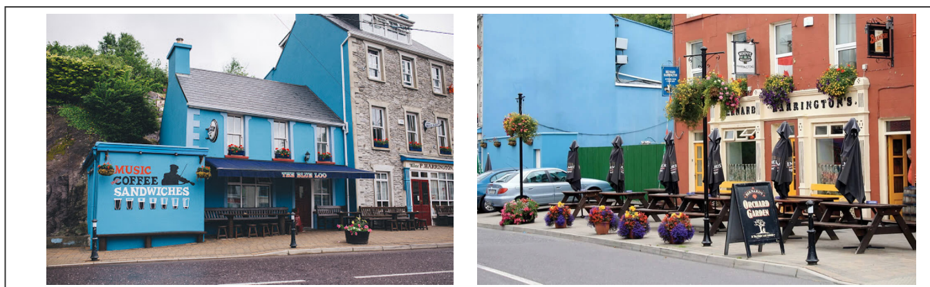
Pubs à Glengariff

Ce matin, je quitte Kenmare et le comté de Kerry pour la grande ville de Cork . Une jolie bosse nous attends dès le départ de cet étape. Ça grimpe régulièrement, mais sûrement. Alors prenez votre courage à deux pieds. La descente qui suit juste derrière est nettement plus sympa. Au pied de la bosse se trouve le charmant village de Glengariff , situé au bord d'un lac.