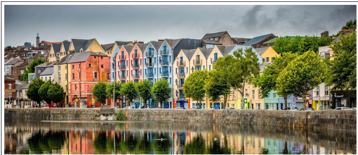
Les rues colorées de Cork