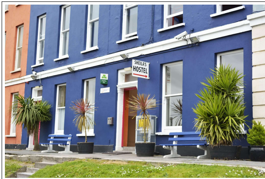
L'auberge de jeunesse de Cork

Ça m'a rappelé ma prime jeunesse, mais j'ai passé la nuit à l'auberge de jeunesse, tout confort, bien tenu, mais bruyant.