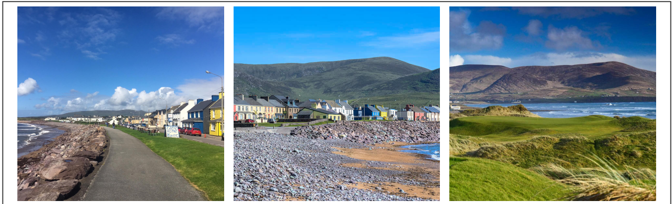
Waterville sur l'anneau de Kerry

Depuis Tralee, j'aurais pu choisir d'aller faire une boucle dans le comté de Dingle et dans la ville du même nom, mais le temps me manquait, alors j'ai préféré descendre directement au sud vers Killorglin et de rejoindre la côte en passant par Waterville , avant de rejoindre Kenmare . La route pour rejoindre Waterville n'est pas de tout repos. Elle fait parti de l'anneau de Kerry (Ring of Kerry) . C'est peut-être la plus difficile que j'ai eu à emprunter. Le dénivelé n'est pas très important, mais les bosses s'enchaînent les unes après les autres. Néanmoins, le coup d'œil sur la route côtière en vaut vraiment la peine.