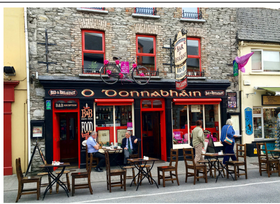
Les rues et les pubs de Kenmare

Fin de cette 8ème étape, assez fatigante, surtout à cause du vent. Mais Kenmare, avec ses nombreux pubs, nous ouvrent l'appétit. Ville vraiment accueillante que je vous conseille de visiter.