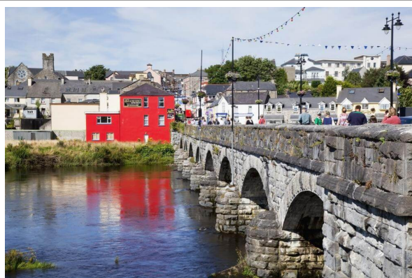
Tralee et Killorglin

Les 25 derniers kilomètres se font sentir. La journée a été sportive. Bien content d'arriver au but fixé, Killorglin , première ville sur l' anneau de Kerry (Ring of Kerry)