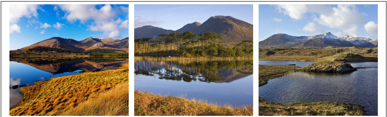
Les lacs du Connemara

Au départ de Louisburgh, la route grimpe gentillement mais sûrement. En réalité, elle va être en dents de scie toute la journée. Après avoir contourné le lac de Killary Harbour, la première halte s'est faite dans le village de Leenane . C'est ici que commence vraiment la région du Connemara. La route qui descend vers Clifden est vraiment hors du temps.