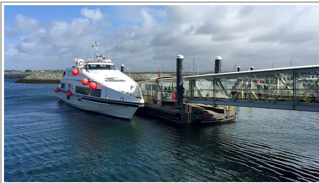
Le ferry pour l'île d'Inishmore

On repart en selle pour traverser les villages de Ballinaboy, Cashel, Gortmore, Costelloe et Rossaveel . La dénivelé est presque plate et avec le vent dans le dos, les 70km qui séparent Clifden de Rossaveel se font à une moyenne de plus de 30km/h. En moins de 2h, j'ai rejoint le port de Rossaveel, d'où partent les ferrys pour les îles d'Aran et plus particulièrement celle qui m'intéressait, Inishmore .