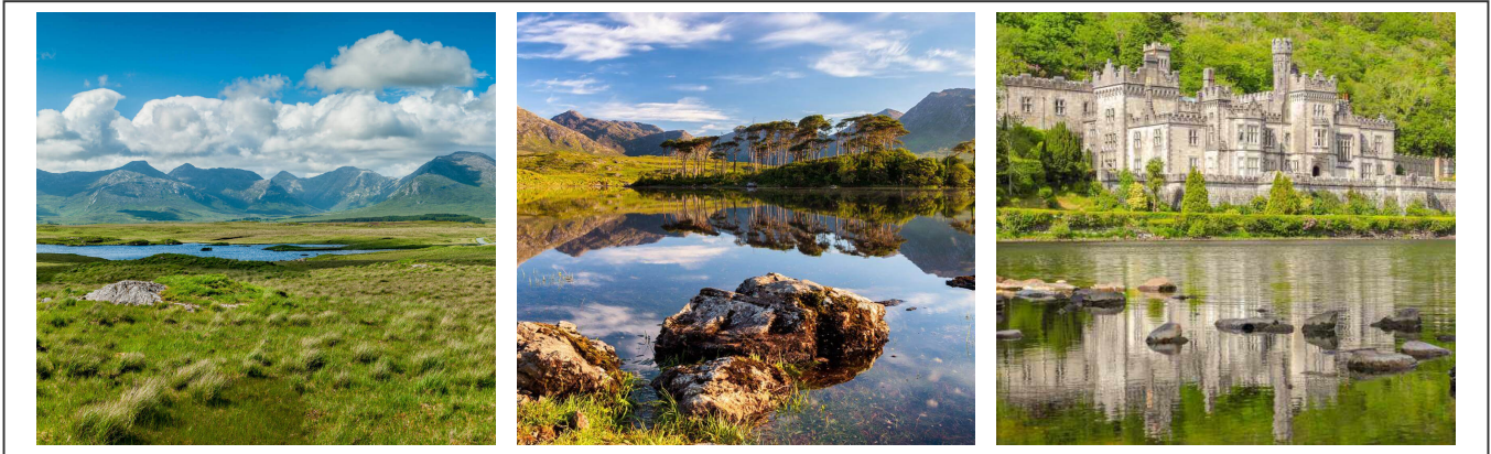
Les lacs du Connemara et l'abbaye de Kylemore

beaucoup de voiture, mais surtout aucun magasin à des lieux à la ronde.