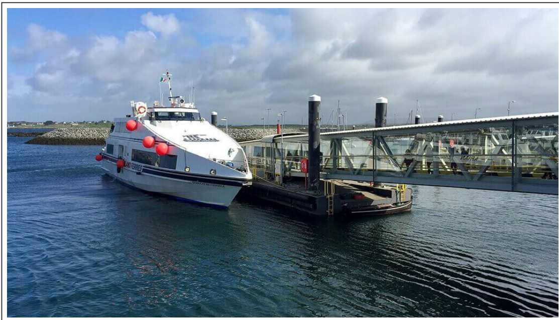
Le ferry pour l'île d'Inishmore

On repart en selle pour traverser les villages de Ballinaboy, Cashel, Gortmore, Costelloe et Rossaveel . La dénivelé est presque plate et avec le vent dans le dos, les 70km qui séparent Clifden de Rossaveel se font à une moyenne de plus de 30km/h. En moins de 2h, j'ai rejoint le port de Rossaveel, d'où partent les ferrys pour les îles d'Aran et plus particulièrement celle qui m'intéressait, Inishmore .