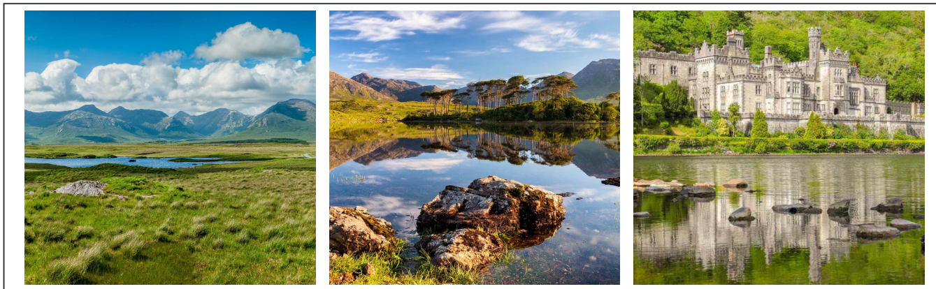
Les lacs du Connemara et l'abbaye de Kylemore

beaucoup de voiture, mais surtout aucun magasin à des lieux à la ronde.