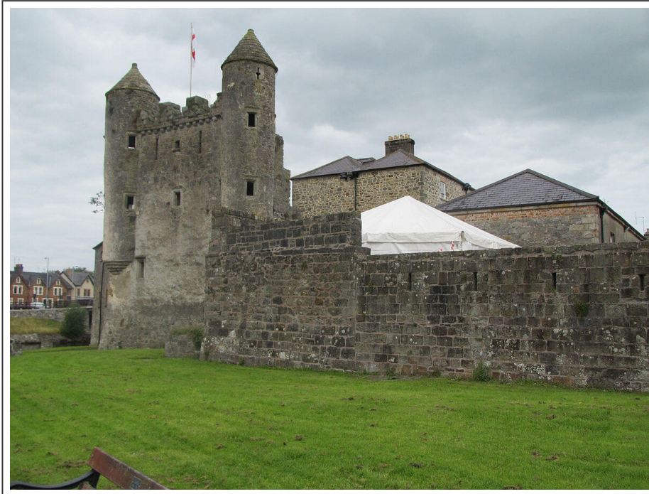
Le château d'Enniskillen