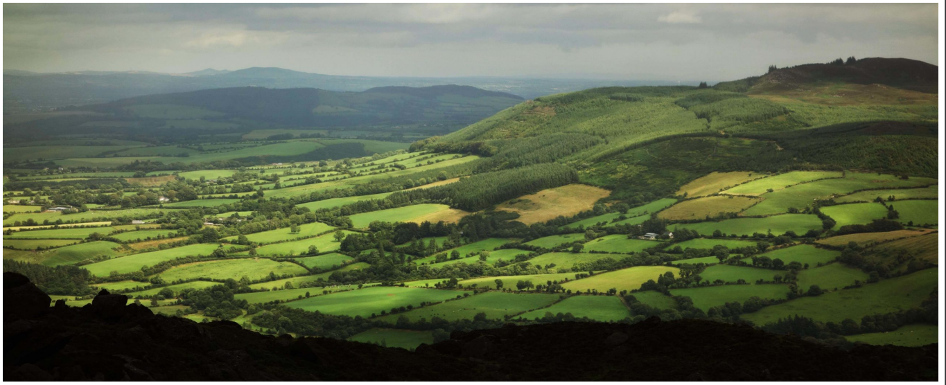
Les légendaires collines vertes de l'Irlande