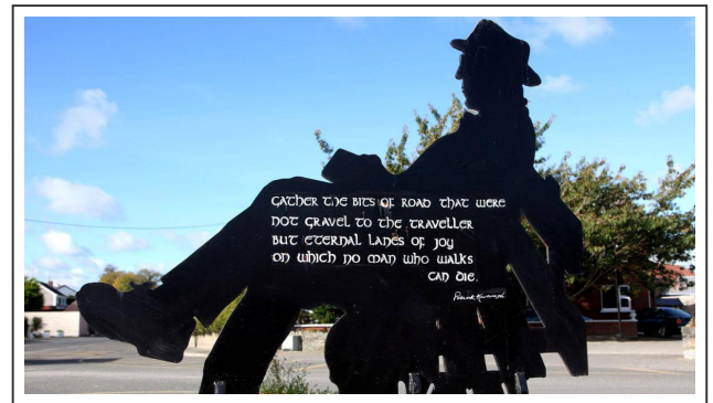
Le poète irlandais Patrick Kavanagh

C'est le village du poète Patrick Kavanagh (1904-1967) . Il a composé bon nombre de textes et chansons de la tradition irlandaise. Il y a un musée en son nom, mais je ne l'ai pas visité.