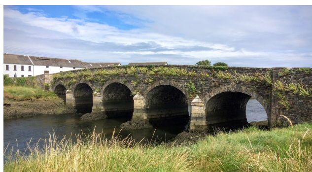
Direction Annagassan par la route cotière