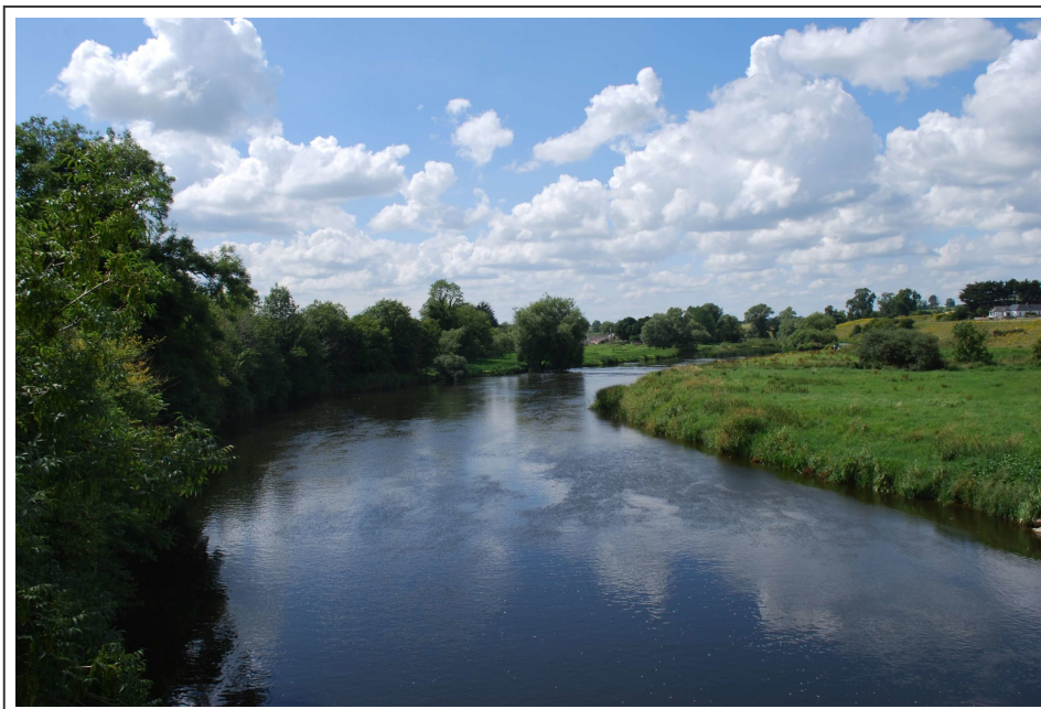
La rivière Boyne

On continue notre route côtière en traversant les villages de Baltray, Termonfeckin, Clogherhead . A la croisée avec la R166 , suivre le vieux panneau jaune pour atteindre le village de Annagassan . La route est vraiment jolie.