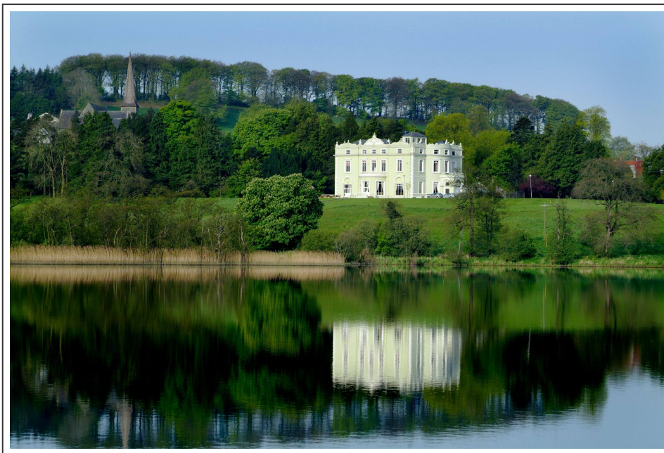
Le château de Castleblayney

Encore une vingtaine de kilomètres et nous arriverons à Monaghan , jolie petite ville du 18ème siècle, épargnée par le tourisme de masse. Un endroit bien plaisant pour s'arrêter et comme d'habitude, finir la journée au pub.