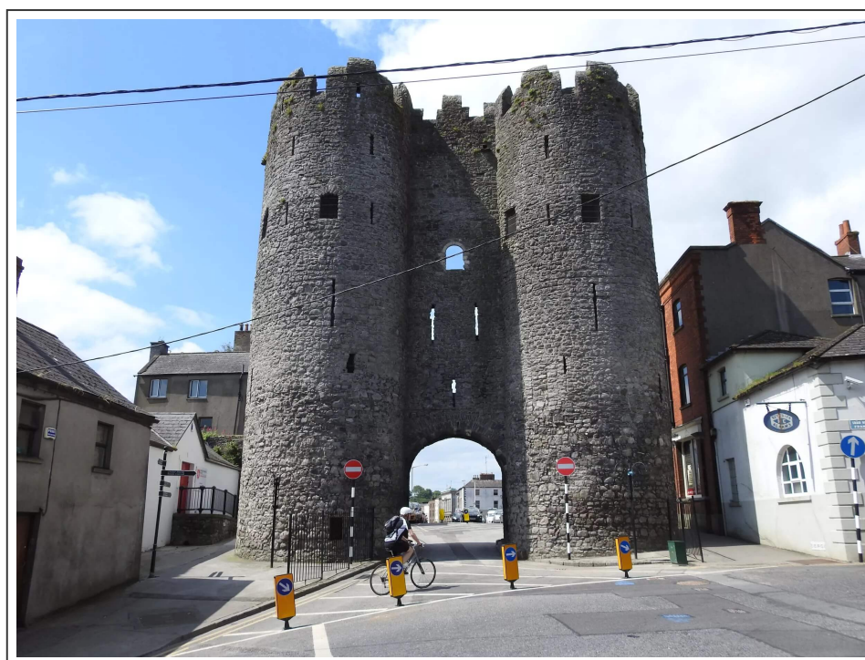
La porte d'entrée de Drogheda

Le comté de Louth est le plus petit d'Irlande. Sa proximité avec Dublin en fait une région où les pendulaires y habitent. C'est une région tranquille. Drogheda est situé à moins de 50km de Dublin, en passant par l'autoroute. A l'origine, c'est une place forte, entourée par la rivière Boyne . Elle compte une imposante cathédrale, de nombreux pubs et restaurants et fait un bon point de chute pour les touristes à vélo.