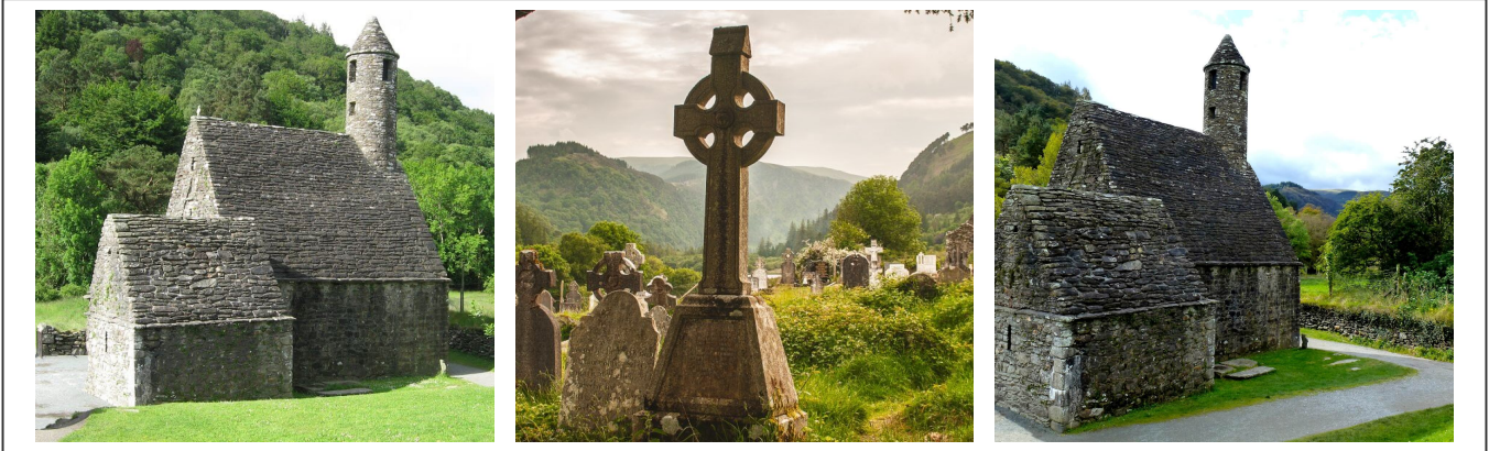
Le cimetière de Glendalough et sa chapelle