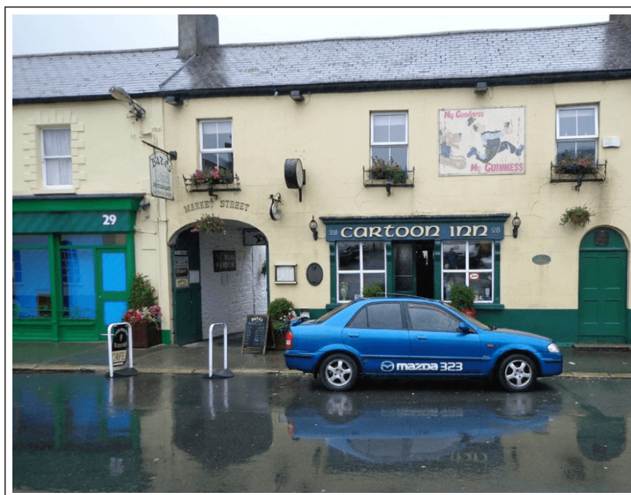
Le Cartoon Inn de Rathrum

Je m'arrête boire un café au Cartoon Inn, et ... je suis jamais reparti. C'est ça aussi le vélo. Il faut savoir dire stop quand la météo vous laisse tomber. J'avais initialement prévu de boucler ce tour d'Irlande en 12 jours, mais je vais finir par le faire en 14 jours.