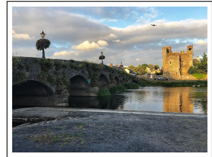
Le château de Leighlinbridge

La route se poursuit sur près de 50km vers Old Leighlin , on passe sous le pont de l'autoroute avant d'atteindre le pont de Leighlinbridge , que nous traversons pour admirer son château.