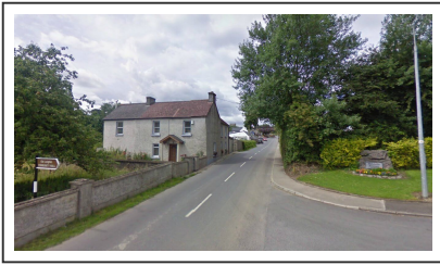
La route vers Old Leighlin

La route se poursuit sur près de 50km vers Old Leighlin , on passe sous le pont de l'autoroute avant d'atteindre le pont de Leighlinbridge , que nous traversons pour admirer son château.