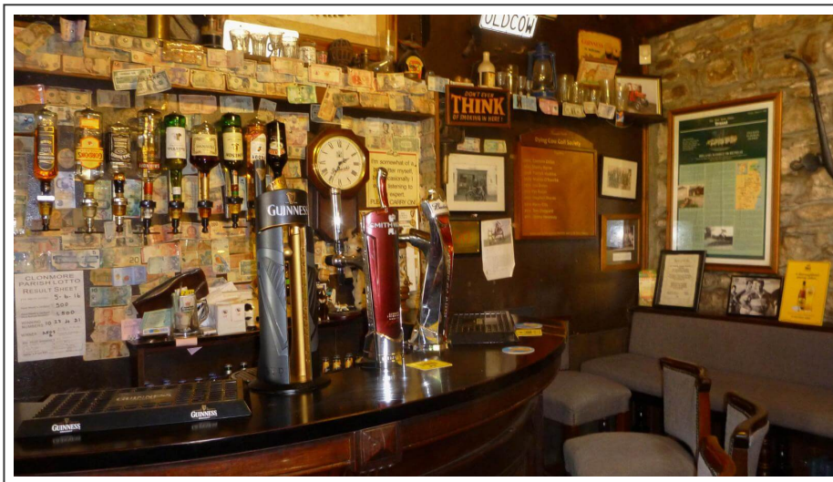
Le pub "The dying cow", Tinahely

Mon choix s'est arrêté sur le pub "The dying cow" . J'adore le nom du pub, littéralement "La vache mourante" . Je me demande si on y mange de bon steak ?