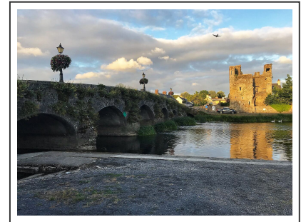
Le château de Leighlinbridge

La route se poursuit sur près de 50km vers Old Leighlin , on passe sous le pont de l'autoroute avant d'atteindre le pont de Leighlinbridge , que nous traversons pour admirer son château.