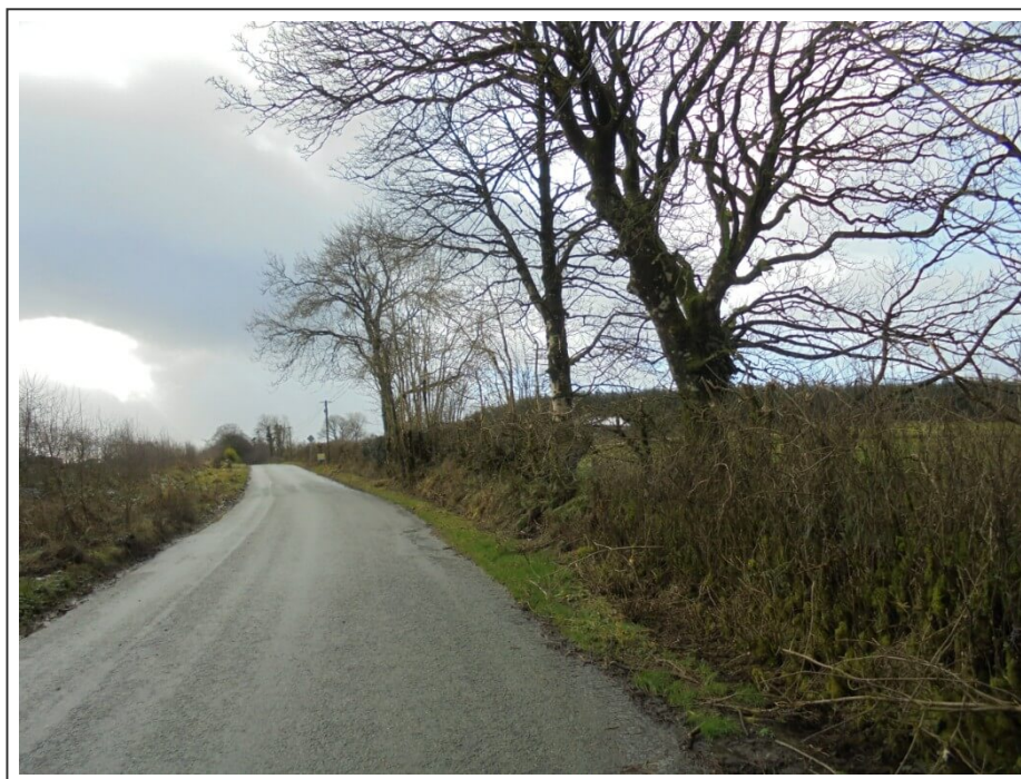
La route vers Castlewarren

La route va nous emmener au travers du village de Castlewarren , puis nous quittons le comté de Killkenny pour rouler dans celui de Carlow.