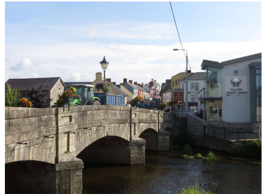
Le village de Tullow et les ruines du château de Clonmore

Tinahely compte moins de 1000 âmes et pourtant, on a l'impression d'être dans une petite ville. Le centre du village est animé et les habitants partagent les quelques terrasses. J'ai rarement vu autant de commerçants pour un aussi petit village. La rivière Derry coule non loin.