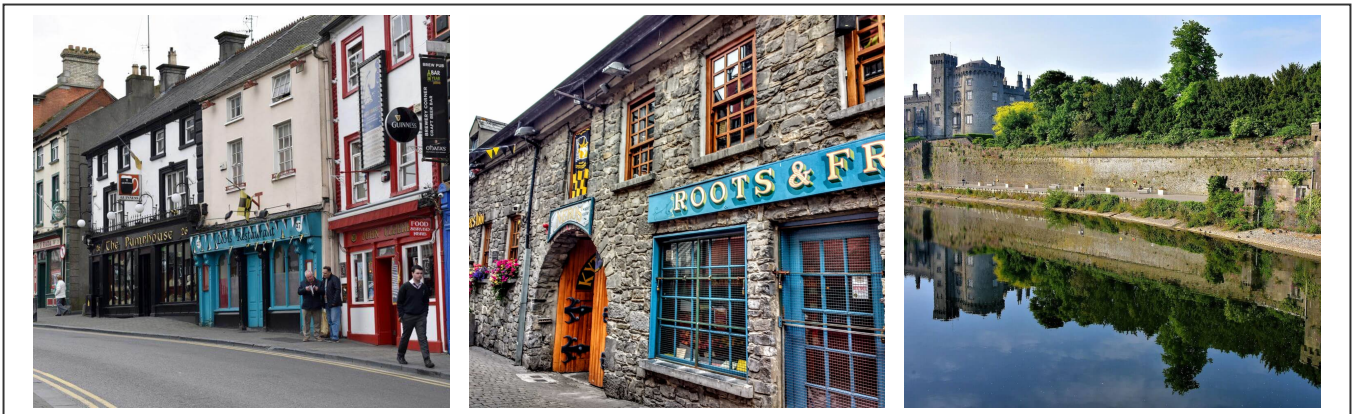
Les rues de Kilkenny et son château

La cité de Kilkenny est bien entendu internationalement reconnu pour sa bière, mais elle possède d'autres atouts de charmes, à commencer par son château. Il a été construit au XIIème siècle. La ville porte le joli nom de cité de marbre.