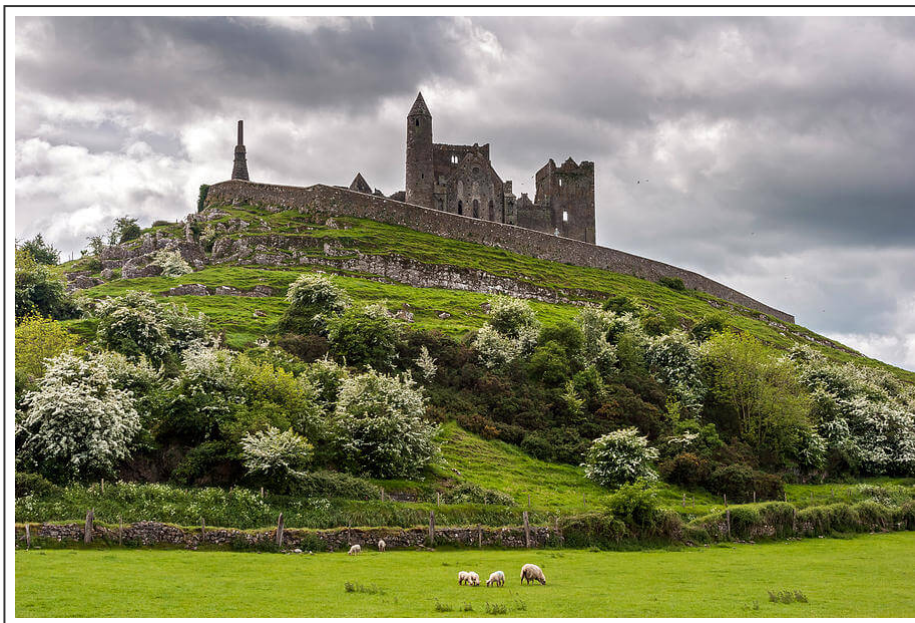
The rock of Cashel

Étape plutôt courte aujourd'hui. Je suis parti seulement vers les 13h de Cashel , pour cause de visite touristique du château ( The rock of Cashel ). Le château est bâti sur une colline verdoyante. C'est une des constructions les plus spectaculaires de toute l'Irlande. Une enceinte robuste entoure une cathédrale de type gothique datant du XIII ème siècle, ainsi que son donjon. D'ailleurs, en gaélique, le nom de Cashel signifie forteresse.