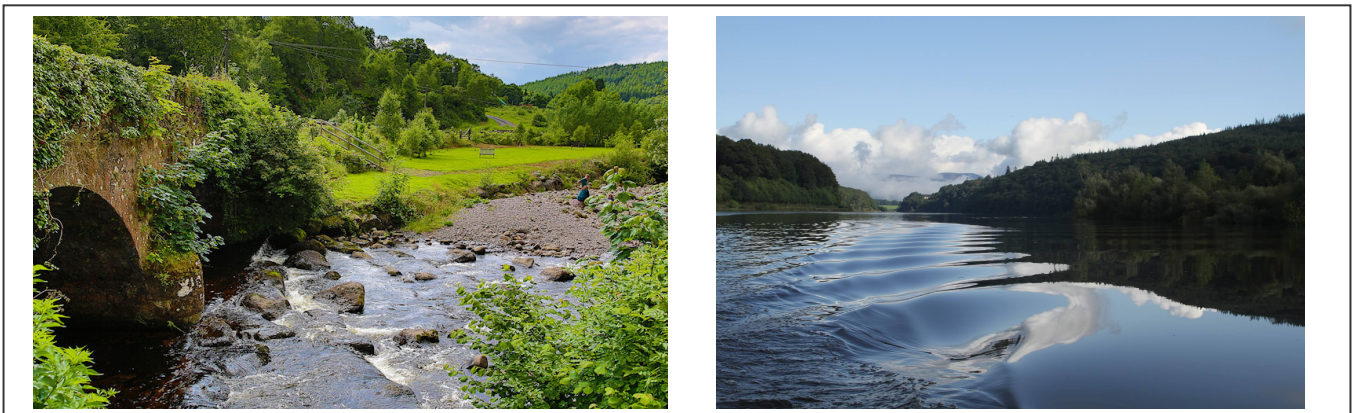
The black river, Cappoquin

L'itinéraire, à la sortie de Cappoquin , s'élève brusquement. La dénivelé grimpe de 300m pendant environ 10km. Un bon petit défi pour digérer l'alcool précédemment ingurgité. La nature est vraiment belle ici et la " Black River " est majestueuse.