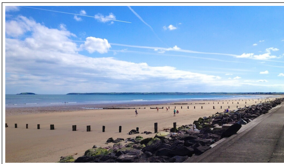
La plage de Youghal

On quitte le comté de Cork pour rejoindre le bord de mer à Youghal , région balnéaire de villégiature pour les habitants de Cork.