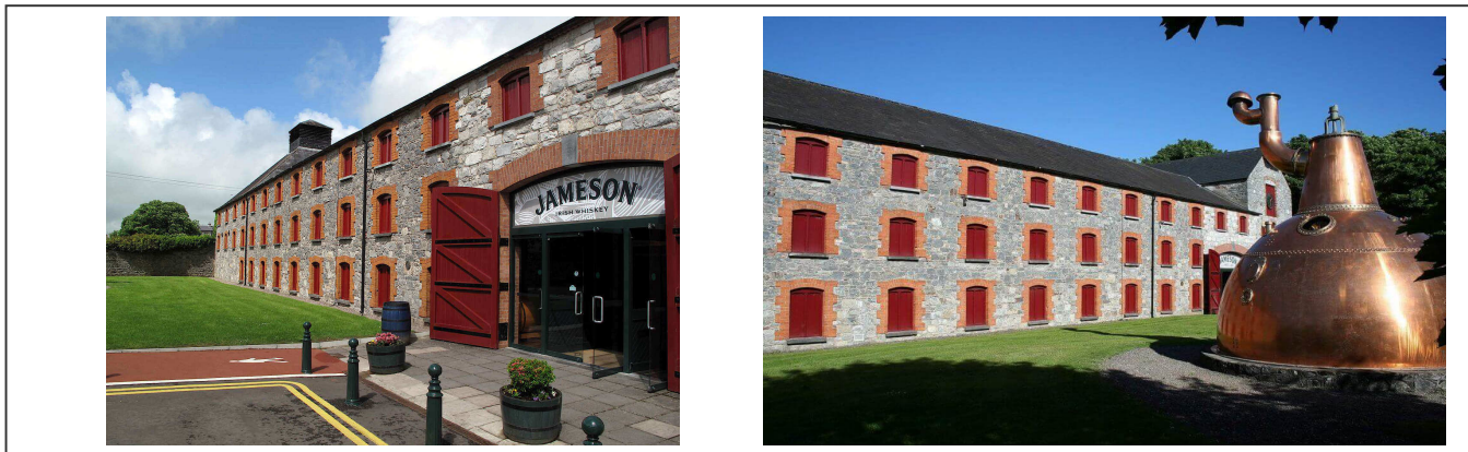
La distillerie de Jameson, à Midleton

fondateur est écossais. Je vous laisse donc polémique.