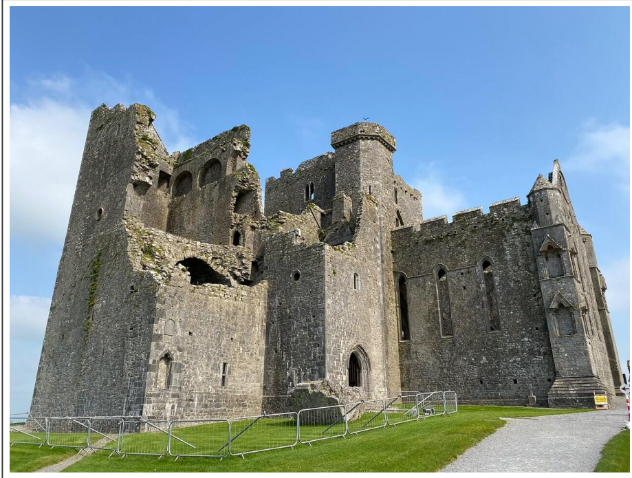
Le château de Cashel