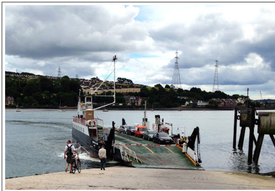
Le ferry de Glenbrook

Pas mécontent de quitter Cork et de retrouver la quiétude de la campagne. Ce matin, on retrouve la piste cyclable en sortant du centre ville de Cork, ce qui est une bonne surprise. Elle se prolonge jusqu'à l'embarcadere du ferry à Glenbrook .