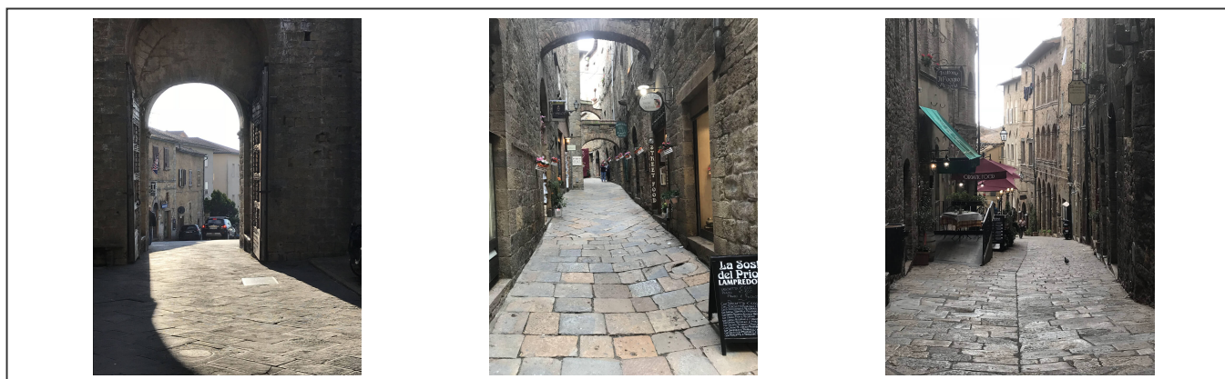
Les rues de Volterra

La ville, cité fortifiée construite au 8ème siècle, possède des murs bien épais. Une fois à l'intérieur, c'est un dédale de ruelles qui s'offre à vous et qui mérite vraiment une petite visite.