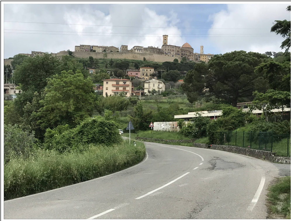
La cité de Volterra