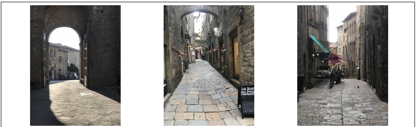
Les rues de Volterra

La ville, cité fortifiée construite au 8ème siècle, possède des murs bien épais. Une fois à l'intérieur, c'est un dédale de ruelles qui s'offre à vous et qui mérite vraiment une petite visite.