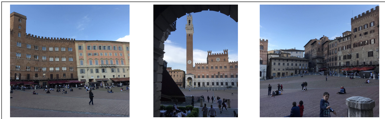
Sienna et sa place centrale

Sienna ou Siena en italien, est une ville bien connue pour son Palio, une grande place transformée deux fois par année en un hippodrome. Les touristes affluent en masse pour assister à ce spectacle. Il y a lieu en été, en juillet et août. Il est très agréable de se perdre dans ses ruelles.