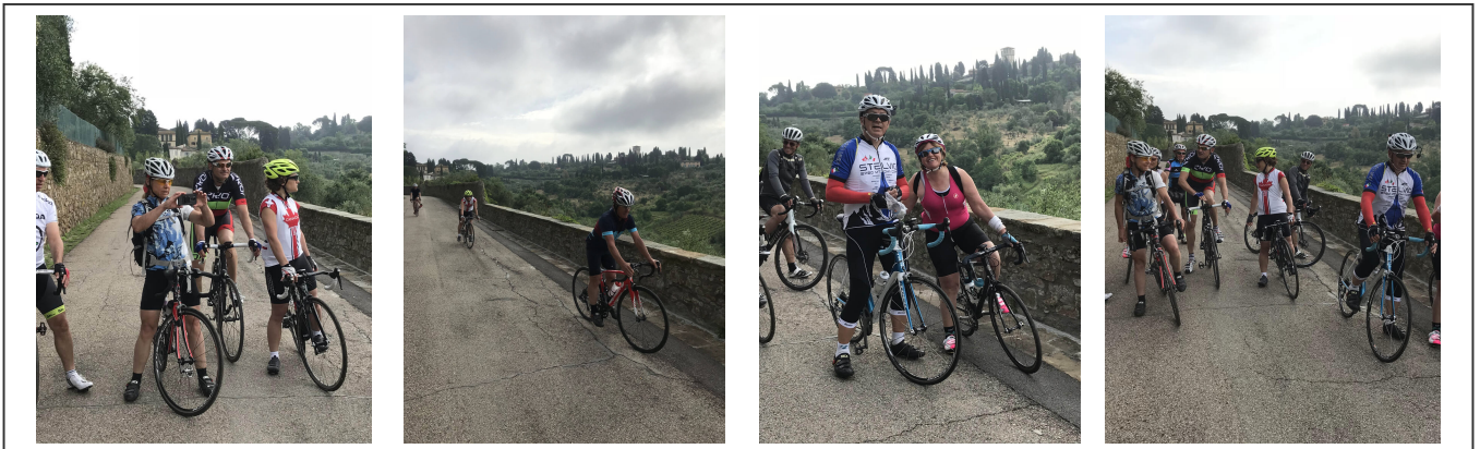
Dans les environs de Florence

Encore une petite journée bien tranquille. Le départ de Florence est tout simplement grandiose. Une route sur les remparts, non autorisée aux véhicules à moteur, permet de s'arrêter et photographier le paysage alentours.