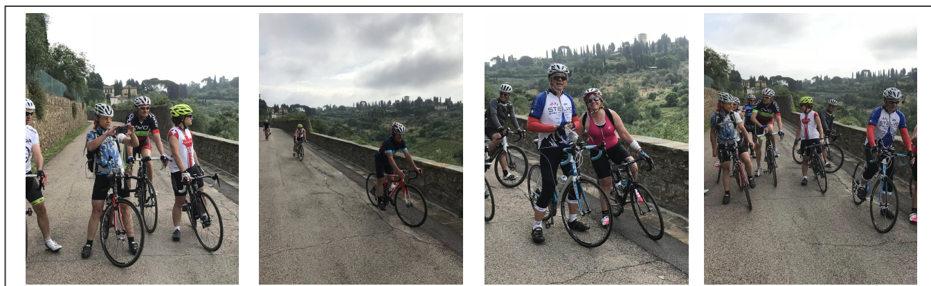
Dans les environs de Florence

Encore une petite journée bien tranquille. Le départ de Florence est tout simplement grandiose. Une route sur les remparts, non autorisée aux véhicules à moteur, permet de s'arrêter et photographier le paysage alentours.