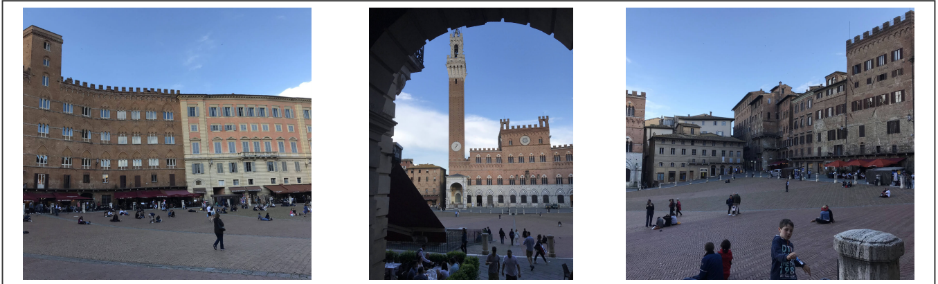
Sienna et sa place centrale

Sienna ou Siena en italien, est une ville bien connue pour son Palio, une grande place transformée deux fois par année en un hippodrome. Les touristes affluent en masse pour assister à ce spectacle. Il y a lieu en été, en juillet et août. Il est très agréable de se perdre dans ses ruelles.