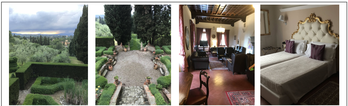
L'hôtel de Florence et son jardin

L'hôtel choisi par Sport Azur, construit sur une colline en dehors de la ville touristique, a été une véritable surprise pour tous les participants. Ça ressemble à un château, avec son jardin. De toute beauté.