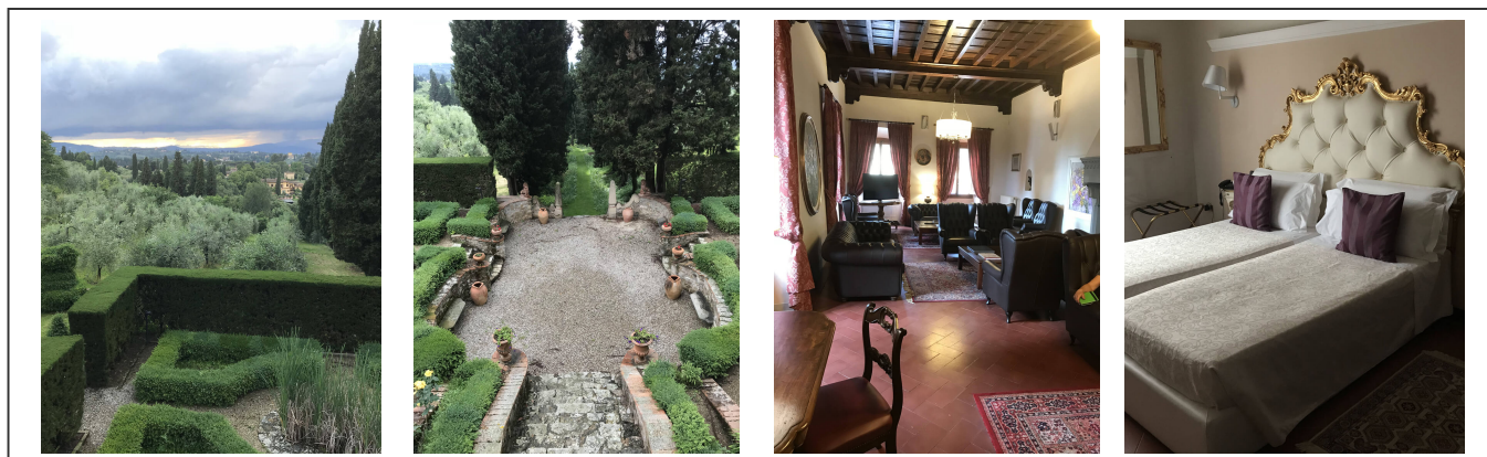
L'hôtel de Florence et son jardin

L'hôtel choisi par Sport Azur, construit sur une colline en dehors de la ville touristique, a été une véritable surprise pour tous les participants. Ça ressemble à un château, avec son jardin. De toute beauté.