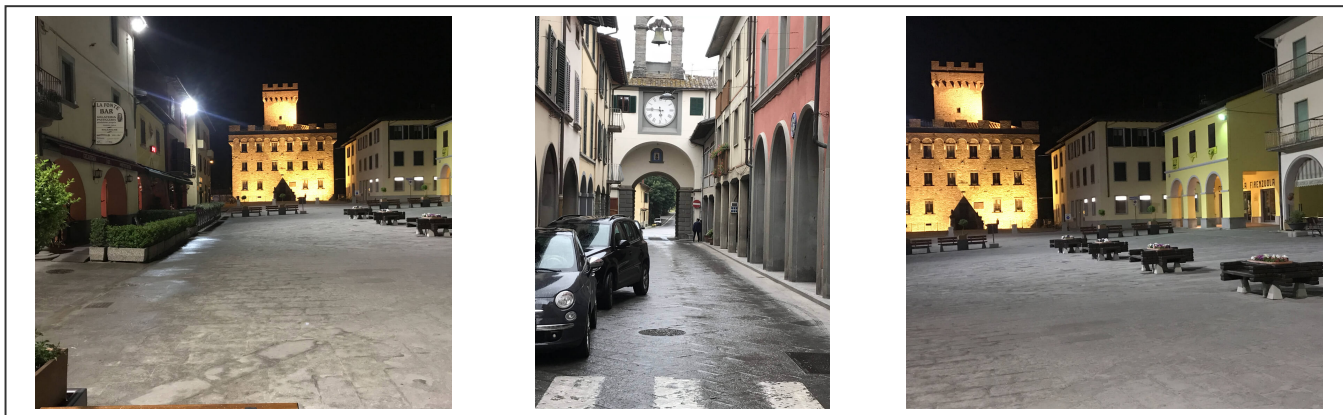
Rue et place centrale de Firenzuola

Firenzuola est une toute petite ville, située à 40km de Florence . Elle ne manque pas de charmes. Sa place centrale et ses ruelles ont gardées leurs cachets médiévale. Il y a plein de boutiques situées sous des arcades, ainsi que des restaurants et des bars, dont la plupart offrent des terrasses.