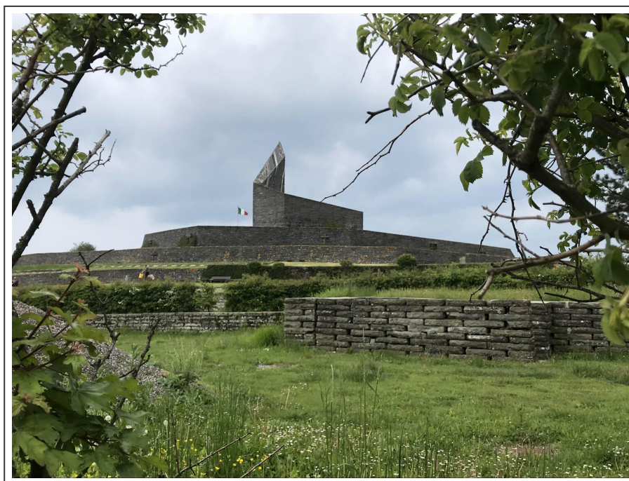
Monument militaire à la sortie de Pievepelago

Ce parcours est montagneux, c'est peu dire. Long de 137km, les bosses s'enchaînent à un rythme effréné. Au bout de la journée, l'impression d'avoir gravi un col n'est pas usurpée, tant le parcours est difficile.