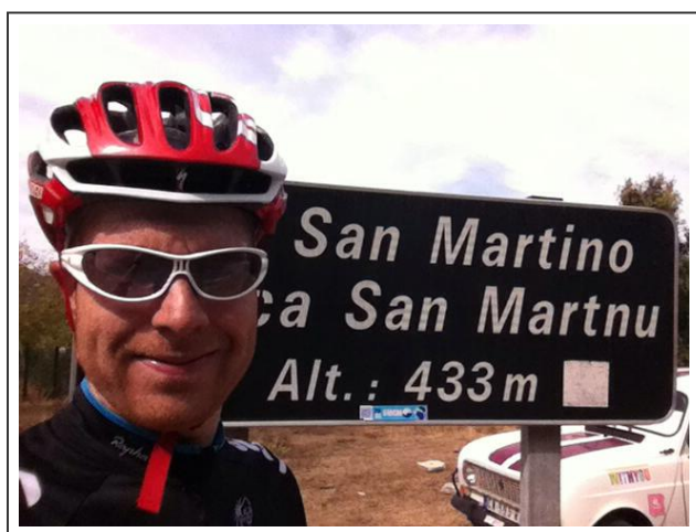
Col de San Martino

Porto est un village très touristique, au bord de la mer. Il est facile d'y trouver un hôtel et profiter de s'y baigner.