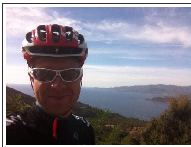
Vue sur la mer