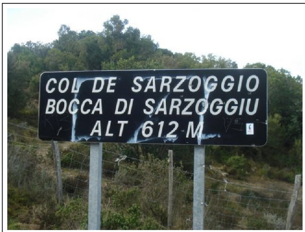
Col de Sarzoggiu

Une relative longue étape de 116km pour atteindre, dans un premier temps, le bord de mer, à la hauteur de Propriano . Puis, on suit le littoral jusqu'à Porticcio . A Bastelicaccia , on emprunte la "D303", puis la "D1", jusqu'au col de "Sarzoggio".