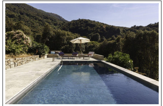
La piscine de la chambre d'hôtes "Le Ruone"

Depuis le col, la route redescend vers la destination de cette étape, le village de Calcatoggio . Le Ruone, juste à la sortie du village, tient quelques chambres d'hôtes en terrasse. La piscine est tout simplement un délice après une si longue journée.