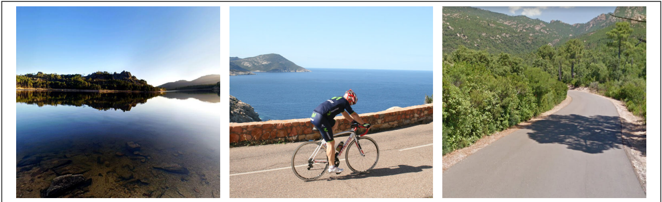
Le réservoir de l'Ospedale et la route en forêt vers Palavesa

Pour se reposer de la veille, les 40 premiers kilomètres jusqu'à Palavesa sont en descente. La route longe le réservoir de l'Ospedale , puis s'enfonce dans la forêt. C'est vraiment tranquille et reposant.