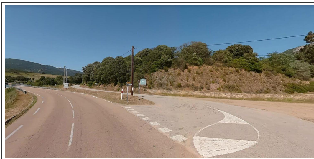
La bifurcation avec la D250

La suite n'est guère plus difficile avec un passage par Muratello, Figari, Pianottoli . Le trafic se fait un peu plus dense, en suivant la "T40" . Au 90 ième kilomètre, la route bifurque à droite pour suivre la "D250" et devient plus étroite en suivant I'Ortolo . Encore une dizaine de kilomètre en montée le long de la rivière, avant de redescendre sur Sartène .