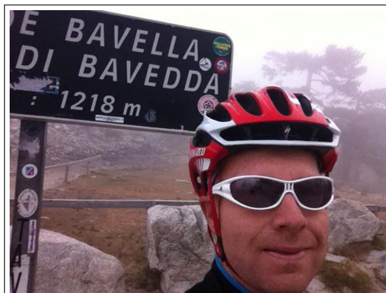
Col de Bavella

Une très longue traversée de plus de 40km sur une route nationale puis, peu avant Solenzara , la route bifurque à droite pour s'élever progressivement sur une quinzaine de kilomètres. La vraie difficulté commence au passage de la Sartène et ceci jusqu'au Col de Bavella. L'importante dénivelé d'environ 1000 mètres sur environ 18km mets la barre très haute C'est une ascension qui demande beaucoup de courage.