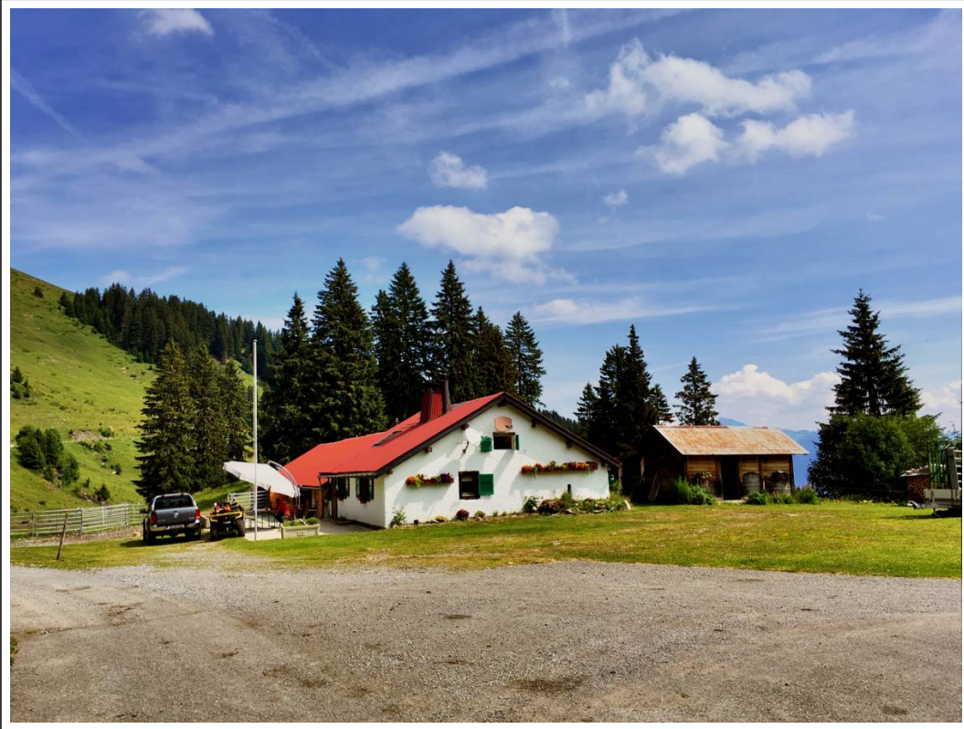
La buvette des Portes de Culet