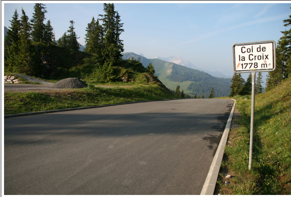
Col de la Croix

A partir du hameau de La Barboleusaz , qui appartient au domaine skiable de Villars-sur-Ollon , la pente augmente à nouveau jusqu'au sommet. A Villars-sur-Ollon , on prend la route du Col de la Croix , sur 15km.