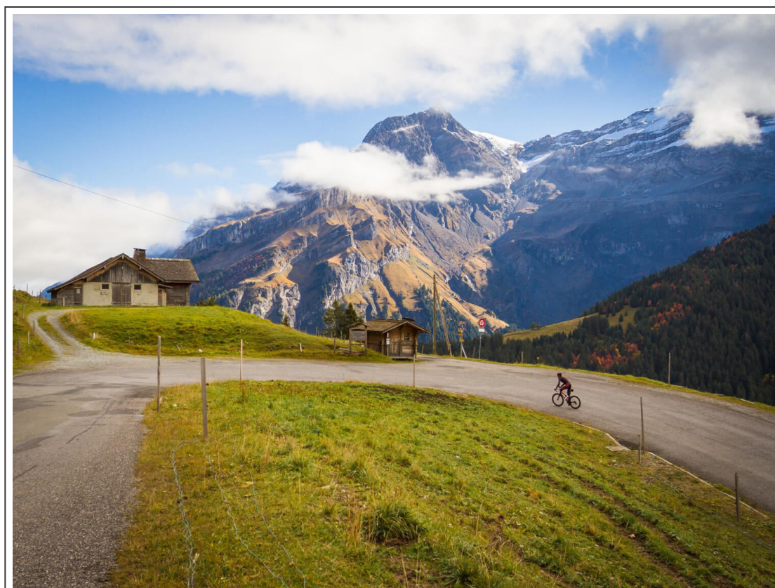
La route du Col de la Croix

Ce parcours est une boucle au départ de Rennaz . Les 17 premiers kilomètres n'ont pas de grandes difficultés. C'est au sortir de Bex que les choses se compliquent. A Bévioux , tourner à droite et suivre la route des plans jusqu'au Plans-sur-Bex . La route s'aplatit alors un peu pour reprendre de plus belle 5km plus loin.