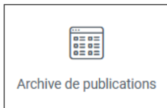
Le widget archive